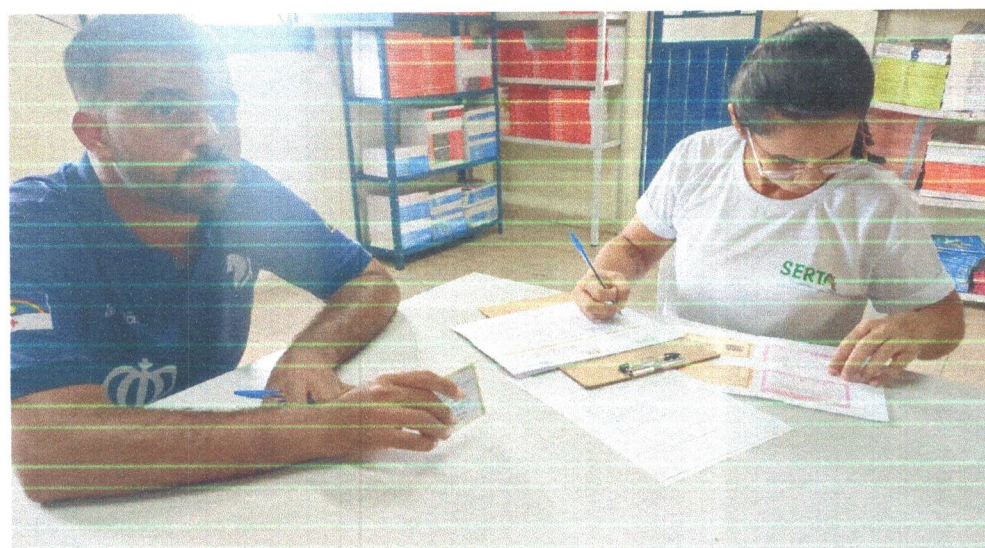
Figura 08: Realização de Inscrição e aplicação de Diagnóstico.