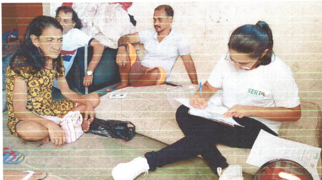
Figura 08: Mapeamento de Mestre de Saberes dos Povos Ciganos.