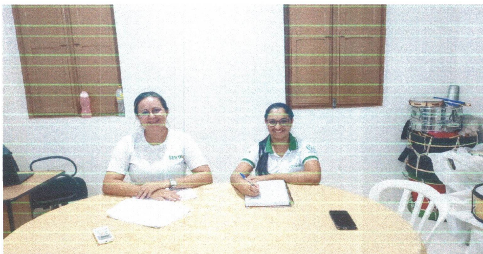
Figura 01: Coordenadora e Educadoras Sociais em reunião de Planejamento.

Iniciamos o mês de fevereiro de 2024, com muitas expectativas, com a Formação continuada da equipe do Projeto, a coordenação geral e as educadoras sociais, onde além da formação traçamos o planejamento das ações para o mês, da Mobilização das Parcerias, das Crianças e Adolescentes, e sobre o andamento da aplicação do Diagnóstico de entrada das Crianças e Adolescentes, e do Diagnóstico dos Mestres de Saberes da Cultura Popular.