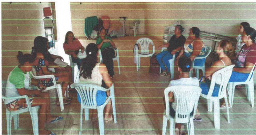
Figura 03: Apresentação do Projeto pais e responsáveis pelas crianças e adolescentes da Escola Cícero Augusto.

Após a apresentação do projeto às turmas da escola deixamos agendada reunião com os responsáveis dos interessados para a apresentação do projeto e a adesão ao mesmo.