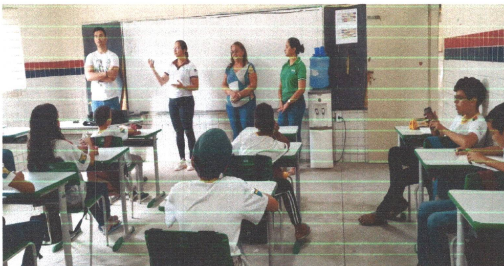
Figura 03: Apresentação do Projeto aos estudantes da Escola Cícero Augusto Gomes.