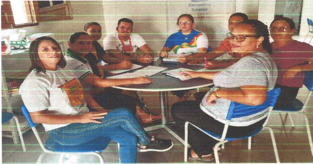
Figura 05: Apresentação do Projeto para os Conselheiros Tutelares do município de Ibibimirim, fortalecendo a Parceira.

E, realizamos visitas de orientação as famílias, realizando inscrições e aplicação do Diagnóstico Participativo e Situacional de Entrada das Crianças e Adolescentes.