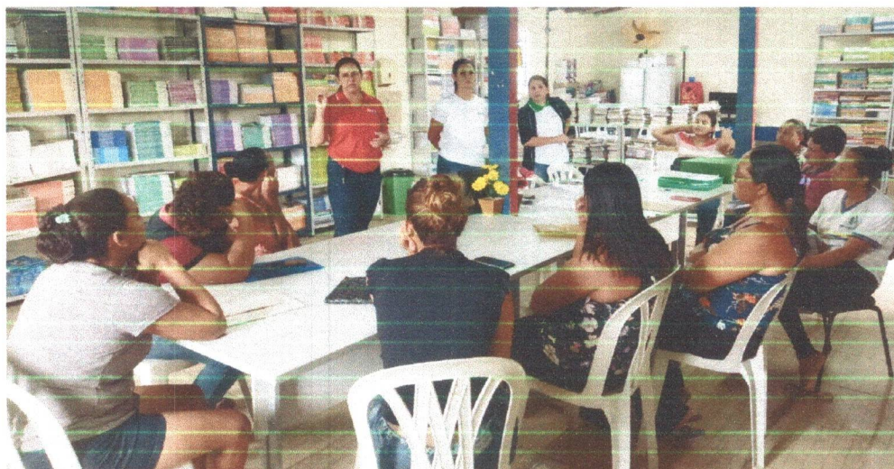
Figura 04: Na fotos responsáveis pelas de crianças e adolescentes apresentação do projeto para as famílias, as lideranças, para as crianças e adolescentes dos Povos Indígenas Kambiwá.

Retornamos a Aldeia Nazários para apresentação do projeto aos familiares e realizarmos as inscrições das crianças e adolescentes.