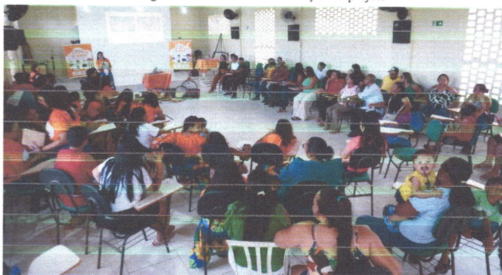
Figura 14: Seminário de avaliação do projeto