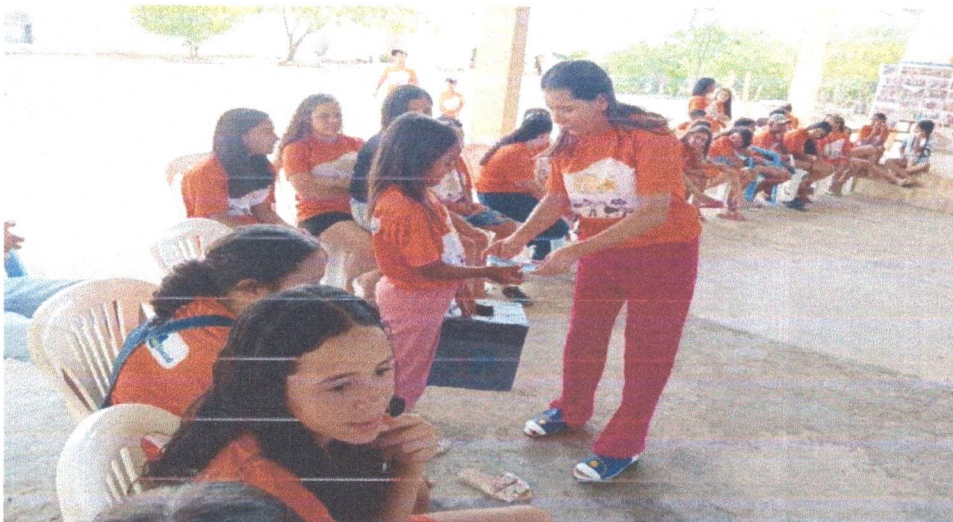
Figura 12: Avaliação de encerramento com as crianças e adolescentes