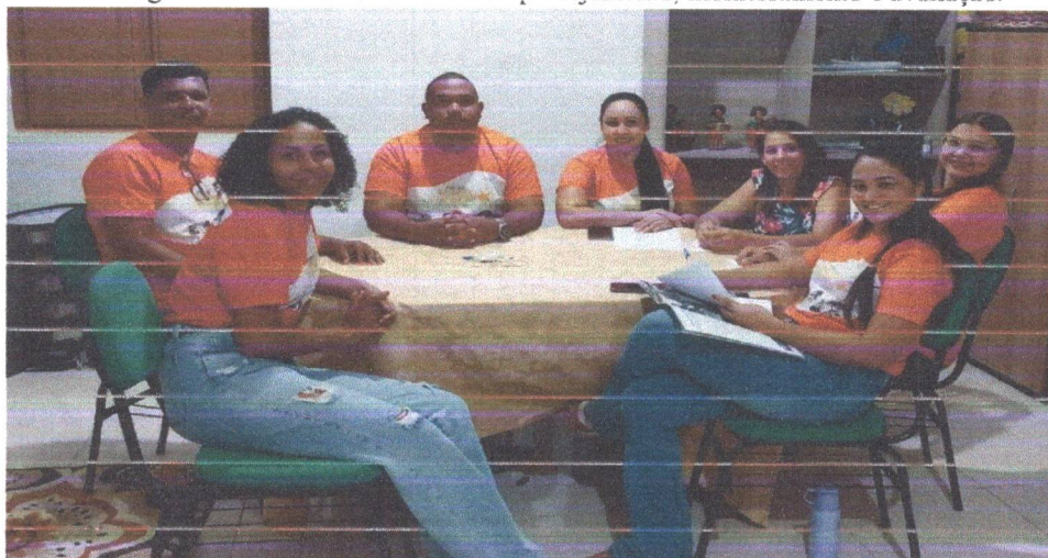
Figura 01: Reunião sistemática de planejamento, monitoramento e avaliação.