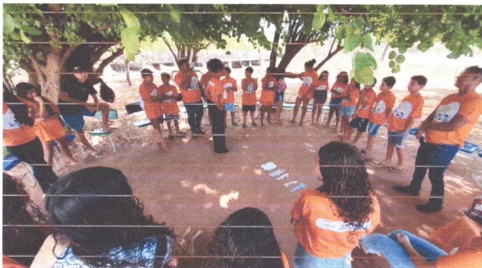
Figura 12: Avaliação de encerramento com as crianças e adolescentes

Encerramos as atividades do projeto Estrelas do Sertão no final do mês de dezembro com atividades diferentes e divertidas. Realizamos uma avaliação com as crianças e adolescentes, e esse foi um momento oportuno para refletir sobre como foi o ano, além de possibilitar a reflexão sobre os aprendizados e as conquistas alcançadas ao longo do projeto.