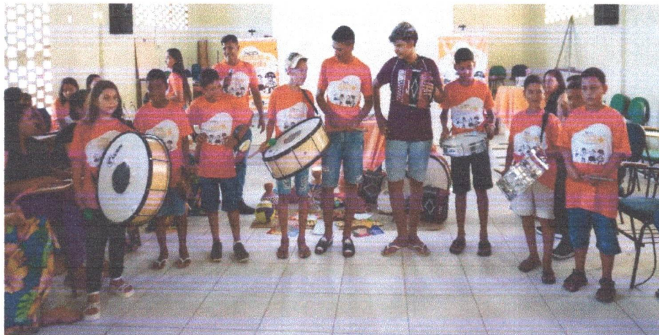
Figura 14: Grupo de interesse de Música - Crianças e Adolescentes em atividade de ensaio.