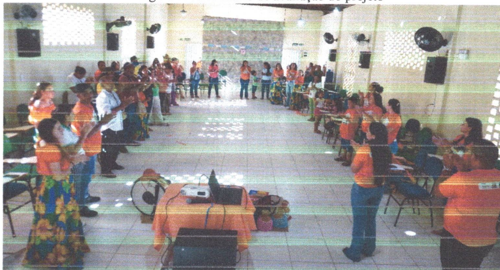
Figura 13: Seminário de avaliação do projeto