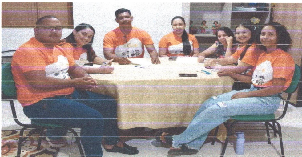
Figura 02: Planejamento e Formação Continuada.

A última reunião sistemática e formação continuada do projeto ocorreu em dois momentos, com foco na discussão da reta final e no objetivo de concluir todas as metas propostas, foi um momento muito especial para toda a equipe.