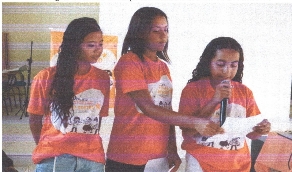
Figura 15: Ensaio do Grupo de Interesse de Poesia com foco no aboio.

3.2 Grupo de Interesse 2: Poesia com literatura, inserindo também a cultura do aboio e cordel, formado e consolidado, onde constantemente é trabalhado a meta de produção textual, e composição de poesias e aboios.