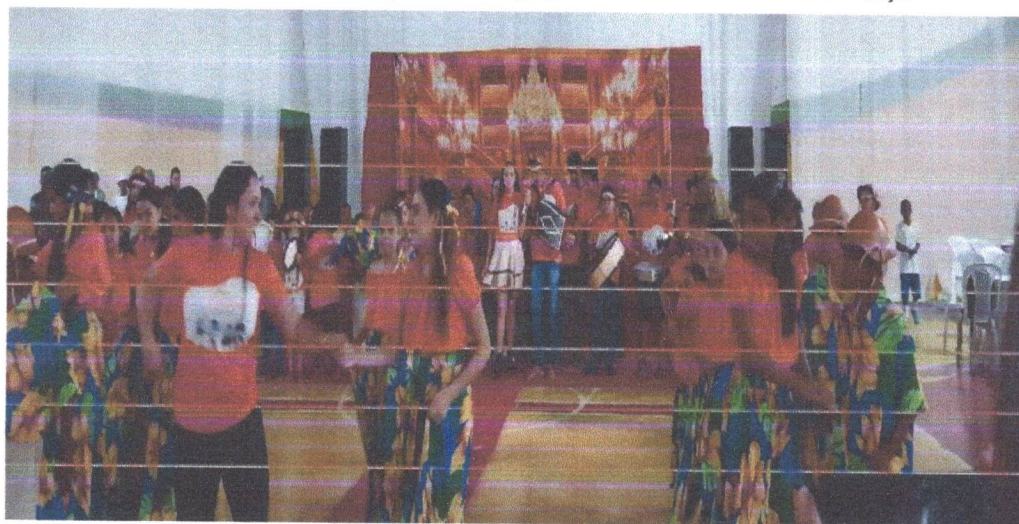
Figura 04: apresentação cultural grupo de interesse de Música e Dança.