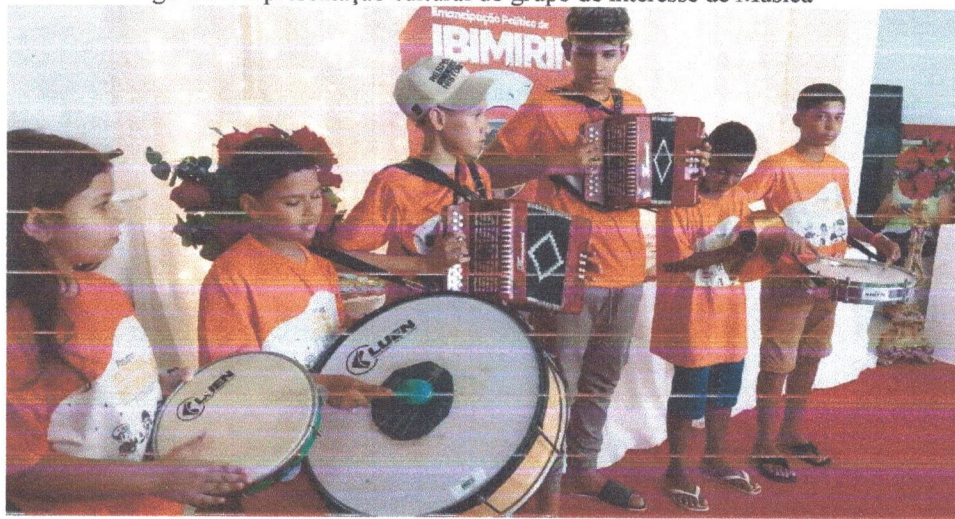
Figura 07: Apresentação cultural do grupo de interesse de Música