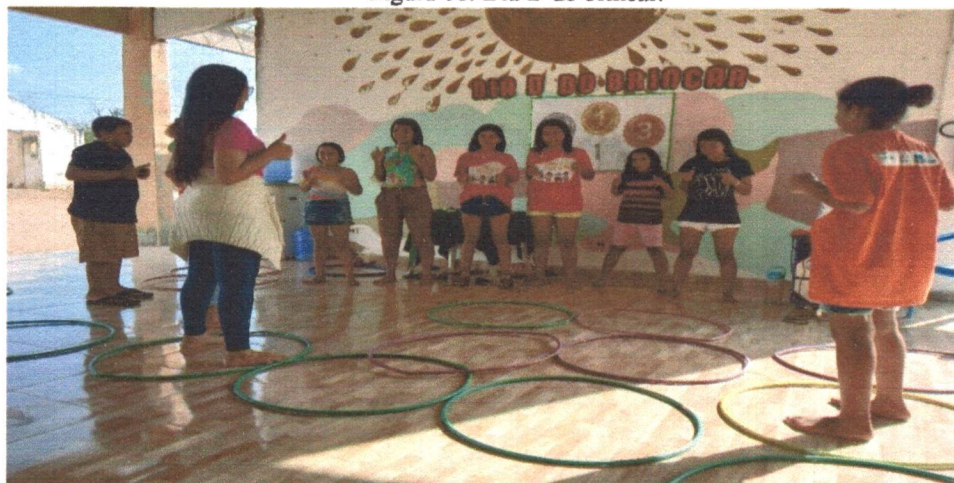
Figura 08: Dia D do brincar.

No mês de agosto, o dia D do Brincar contou com jogos e brincadeiras competitivas com a realização de torneios, onde as crianças e adolescentes tiveram a oportunidade de desenvolver as suas habilidades, coordenação motora, agilidade e raciocínio, assim estimulando a competição justa entre as crianças e os adolescentes. Tendo como objetivo fazer com que sejam estimulados não apenas a competitividade, mas em especial o raciocínio e o respeito às regras.