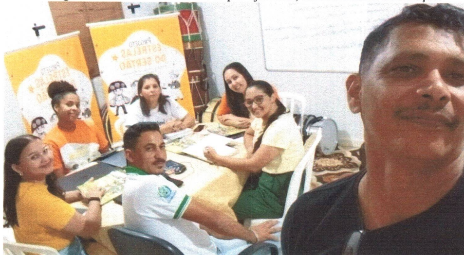
Figura 01: Reunião sistemática de planejamento, monitoramento e avaliação.