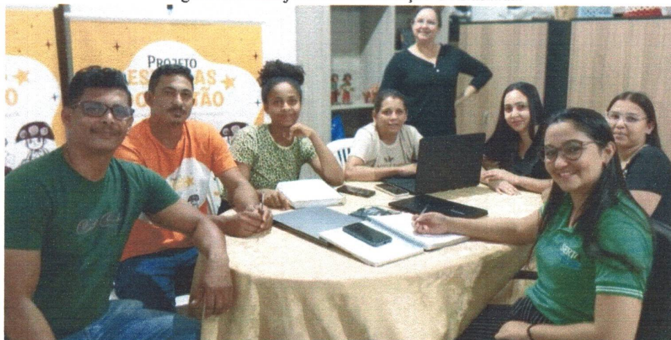
Figura 02: Planejamento e Formação Continuada.

A formação continuada da equipe do projeto também é sempre realizada no início do mês, trabalhar essa formação possibilita toda a equipe traçar metas e estudar a metodologia do Programa Educacional de Apoio ao Desenvolvimento Sustentável - PEADS para ser aplicada nas ações a ser trabalhadas.