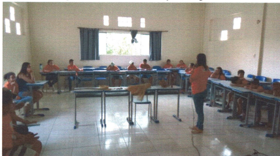
Figura 05: Oficina educativa sobre povos indígenas.