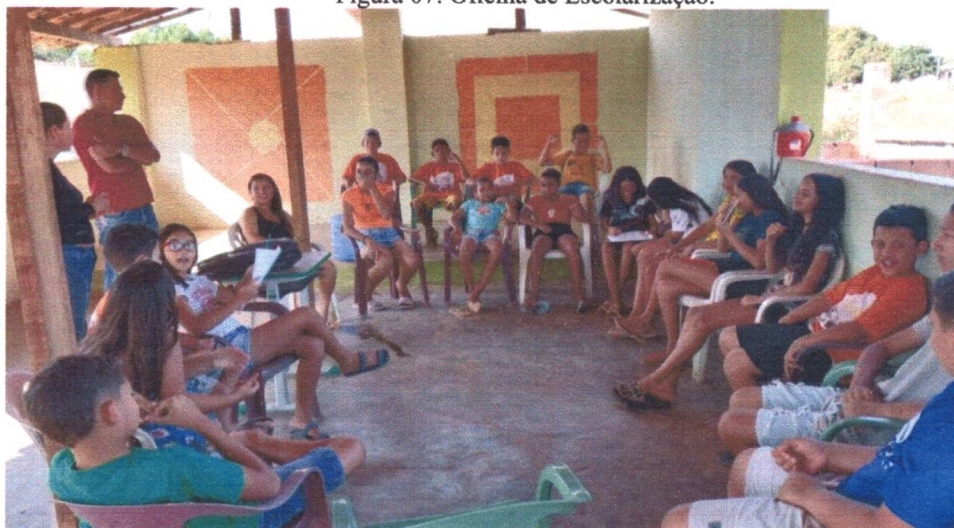
Figura 07: Oficina de Escolarização.

As atividades de Escolarização são fundamentais no fortalecimento das aprendizagens das crianças e adolescentes do projeto, tem contribuído habilidade importantes para o desenvolvimento de cada criança.