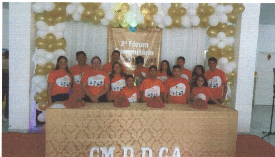
Figura 06: Participação do Fórum Comunitário do Selo UNICEF.