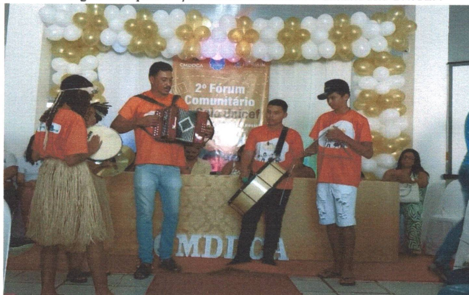
Figura 07: Apresentação cultural no Fórum comunitário selo UNICEF.