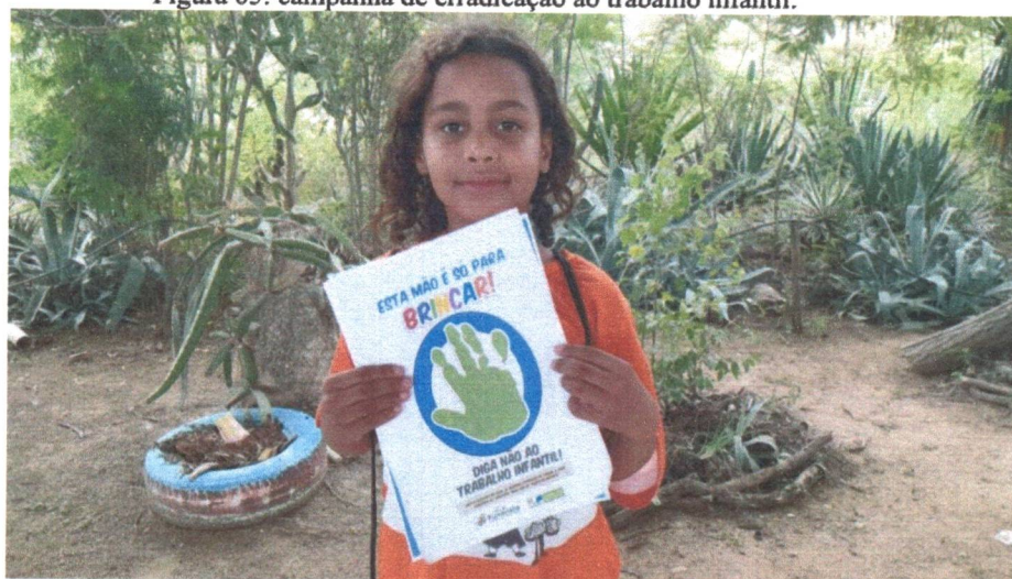
Figura 05: campanha de erradicação ao trabalho infantil.