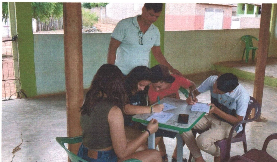
Figura 10: Oficina de Escolarização.