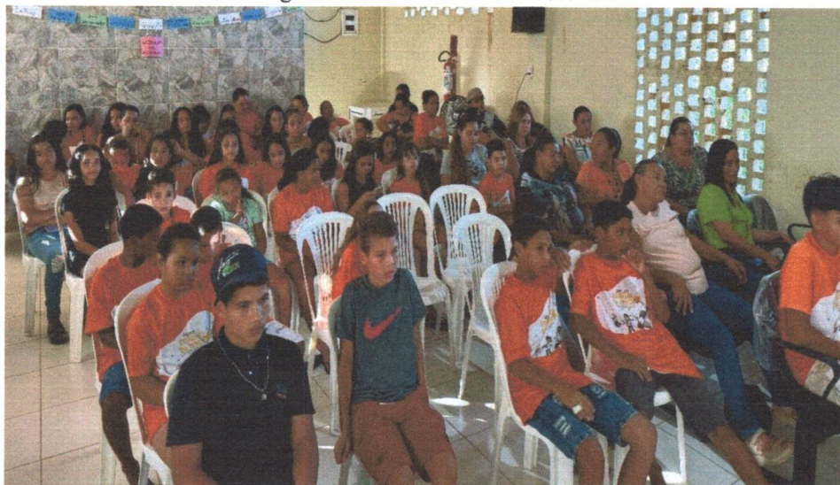
Figura 13: Dia da Família na Escola.