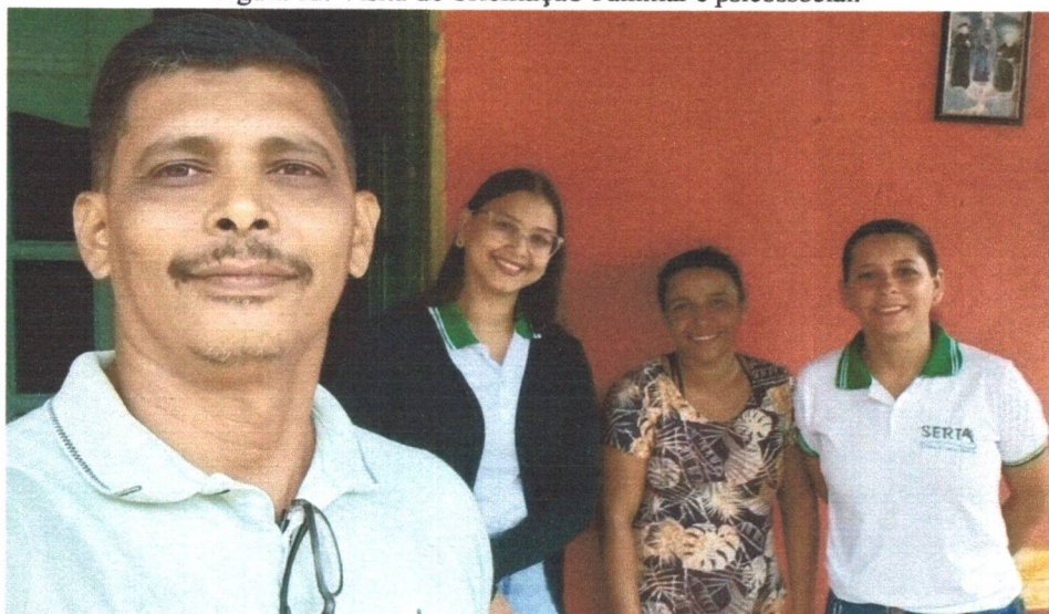
Figura 12: Visita de orientação Familiar e psicossocial.