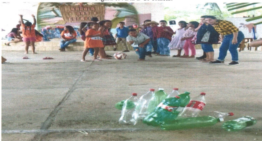
Figura 09: Dia D do brincar.