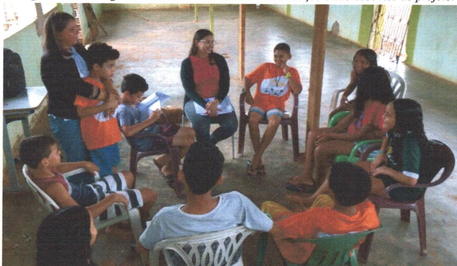
Figura 11: na imagem um atendimento coletivo de crianças e adolescentes do projeto.