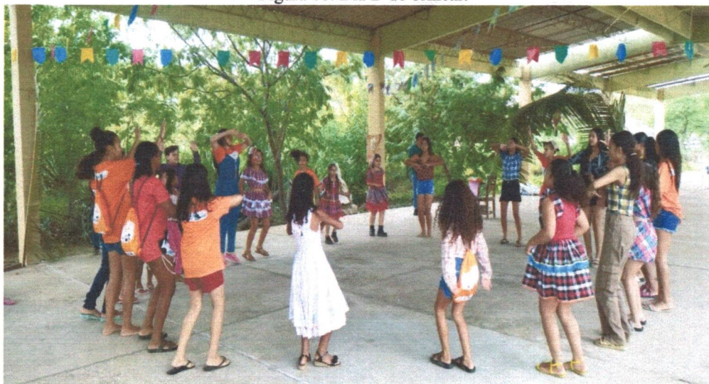
Figura 08: Dia D do brincar.