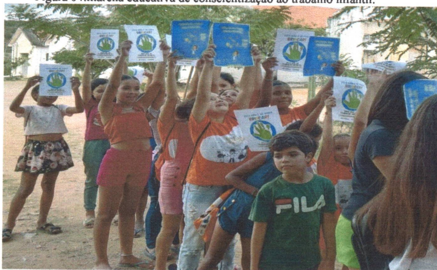
Figura 04: marcha educativa de conscientização ao trabalho infantil.

Durante a campanha foi realizado palestras, rodas de diálogo, dinâmicas, atividades lúdicas e marcha educativa de conscientização.