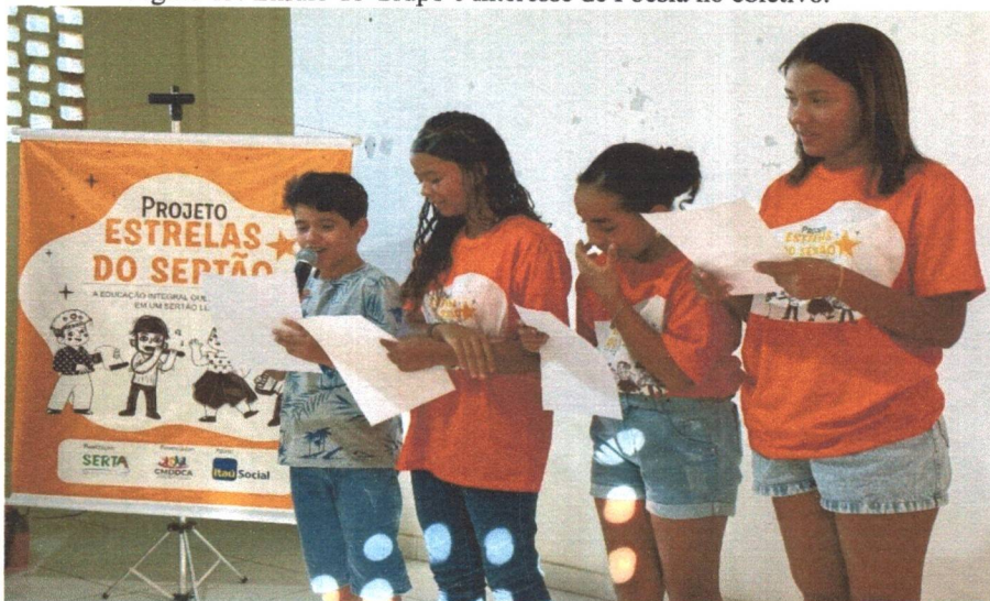
Figura 15: Ensaio do Grupo e Interesse de Poesia no coletivo.