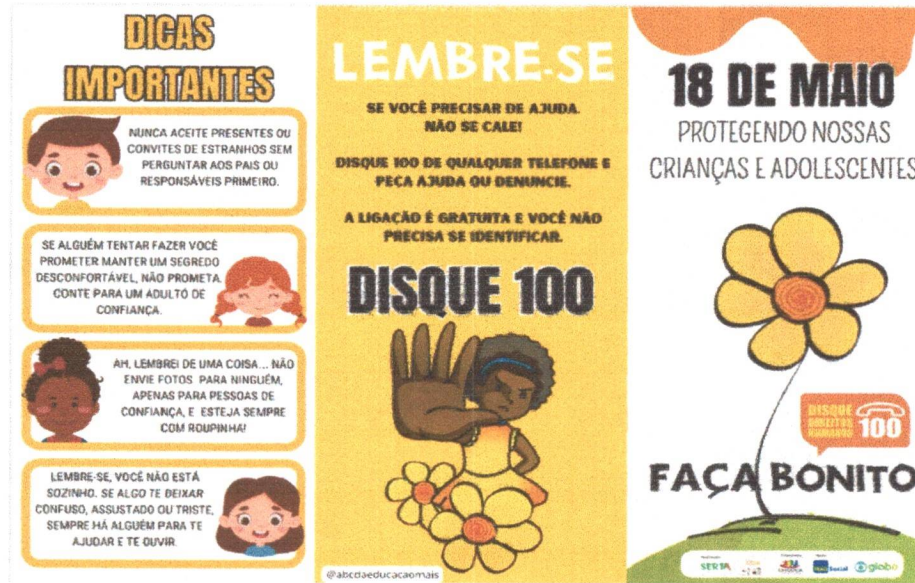
Figura 10: Panfleto Campanha.