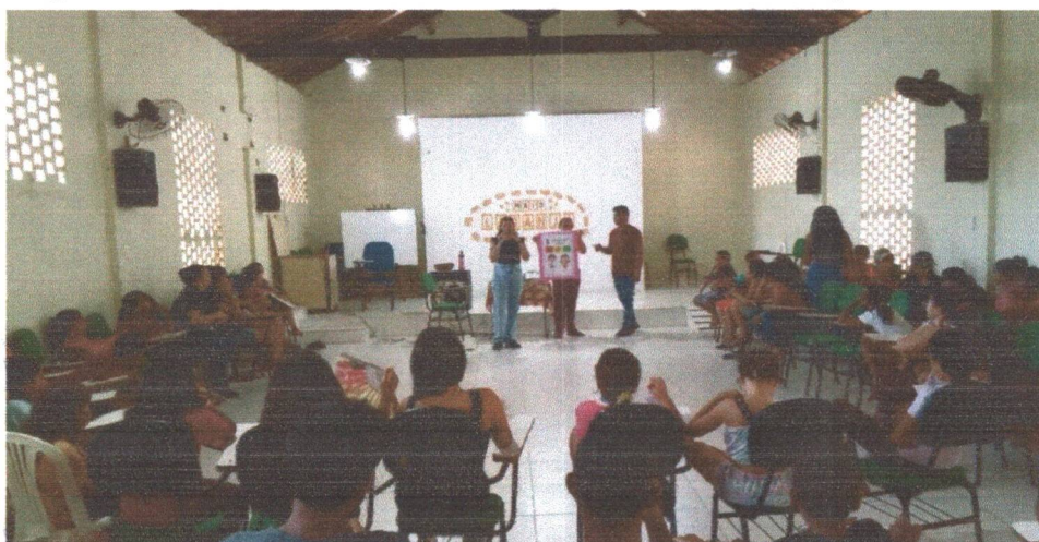
Figura 04: Palestra com o tema " combate ao abuso sexual contra crianças e adolescentes ".