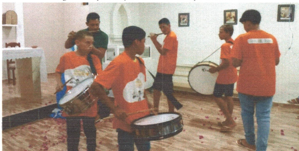
Figura 12: Apresentação Cultural das crianças e adolescentes.

“Estamos muito felizes com o projeto Estrelas do sertão, na qual tem proporcionado e abrilhantado as nossas crianças e os adolescentes da comunidade a aprenderem a tocar instrumentos, assim oportunizando eles realizar o resgate das nossas tradições culturais e por isso o SERTA está de parabéns pelo excelente trabalho”.