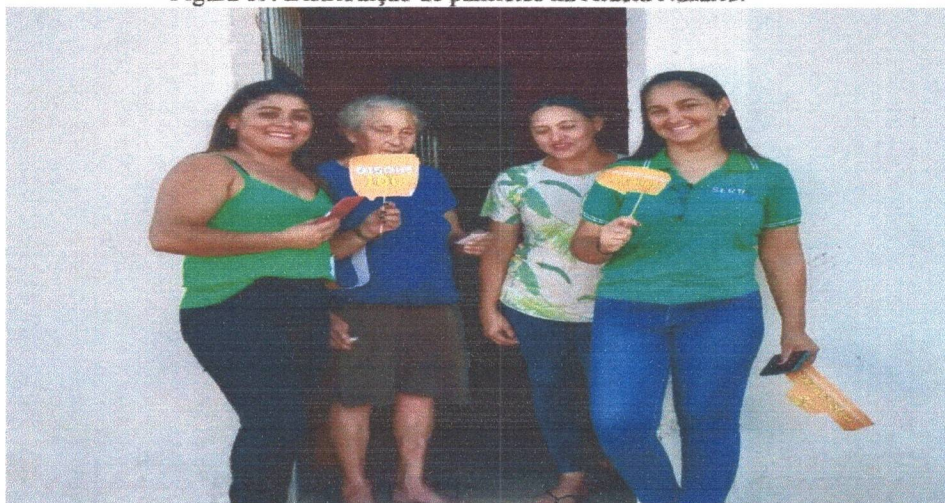
Figura 09: Distribuição de panfletos na Aldeia Nazário.

Durante a campanha foi realizado palestras, rodas de diálogo, dinâmicas, atividades lúdicas, distribuição de cards, panfletos, citação de poesia, apresentação com música etc.