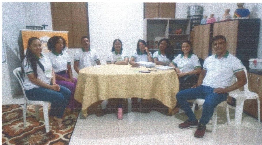
Figura 01: Planejamento e Formação Continuada.

O mês de maio de 2024 foi iniciado com grande entusiasmo, com o Planejamento e a Formação continuada da equipe do Projeto, a Coordenação Geral, os Educadores Sociais, Psicóloga, auxiliar administrativa e os Artes Educadores dos grupos de Interesse de Música, Dança e Poesia/ foco no aboio, onde além da formação avaliamos em equipe as metas a serem cumpridas no mês de maio.