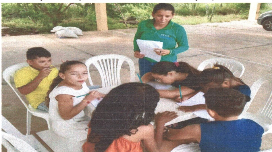
Figura 05: Devolutiva da atividade lúdica com o semáforo do toque e construção do mural do combate ao abuso e exploração sexual.