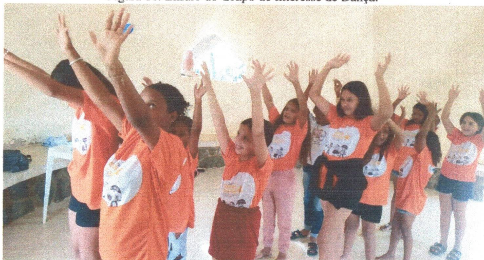
Figura 16: Ensaio do Grupo de Interesse de Dança.