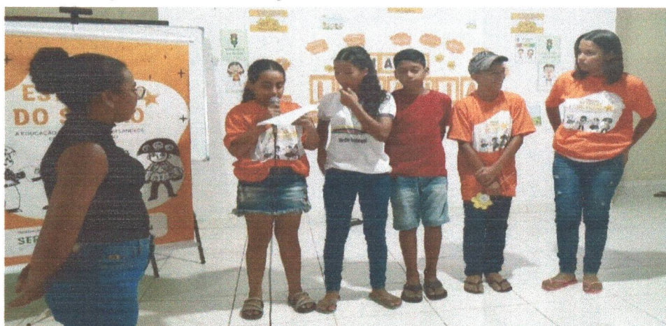
Figura 15: Ensaios do Grupo e Interesse de Poesia no coletivo.

3.2 Grupo de Interesse 2: Poesia com literatura, inserindo também a cultura do aboio e cordel, formado e consolidado.