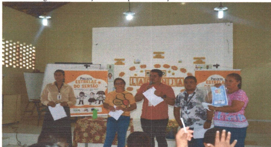
Figura 11: Formação Política para as crianças e adolescentes.

Em parceria com Conselho do Tutelar realizamos uma palestra de política de formação para as crianças e adolescentes para a fim de evidenciar sobre seus direitos e deveres a partir do Estatuto da Criança e adolescente-ECA, além de trazer sobre as atribuições do Conselho Tutelar.