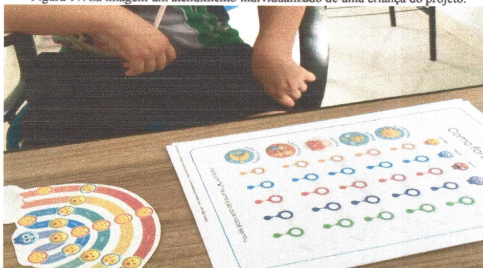
Figura 17: na imagem um atendimento individualizado de uma criança do projeto.

No mês de maio foram realizados os atendimentos de forma individual e coletivo, oportunizando formar e criar laços: construindo uma aliança terapêutica com as crianças e adolescentes.