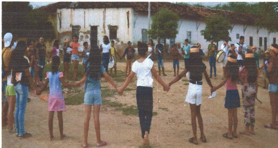
Figura 08: Caminha pela comunidade de Poço da Cruz com as crianças e adolescentes.