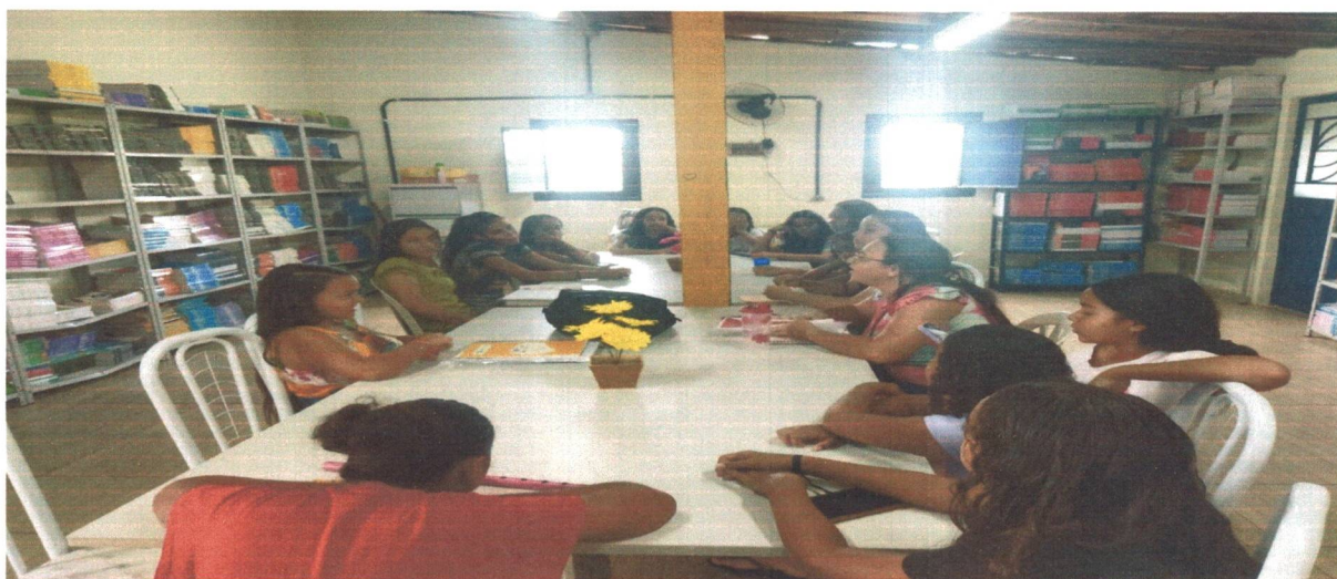
Figura 03: Palestra sobre pobreza menstrual com as meninas dos grupos de interesse.