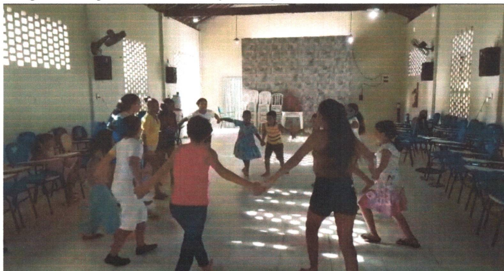
Figura 16: Grupo de interesse de Dança - Crianças e Adolescentes em atividade de ensaio.