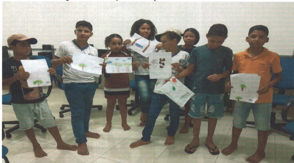
Figura 15: Ilustração sobre a poesia coletiva.