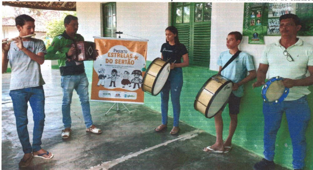
Figura 13: Grupo de interesse de Música - Crianças e Adolescentes em atividade de ensaio.

3.1 Grupo de Interesse: Música, estimulando a cultura local com a musicalidade dos instrumentos de pífano instrumentalizado e sanfona, formado no campus do SERTA Página | 14 Ibimirim.