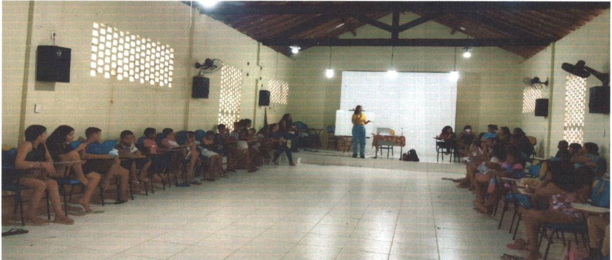
Figura 02: Palestra sobre o bullying para as crianças e adolescentes do projeto