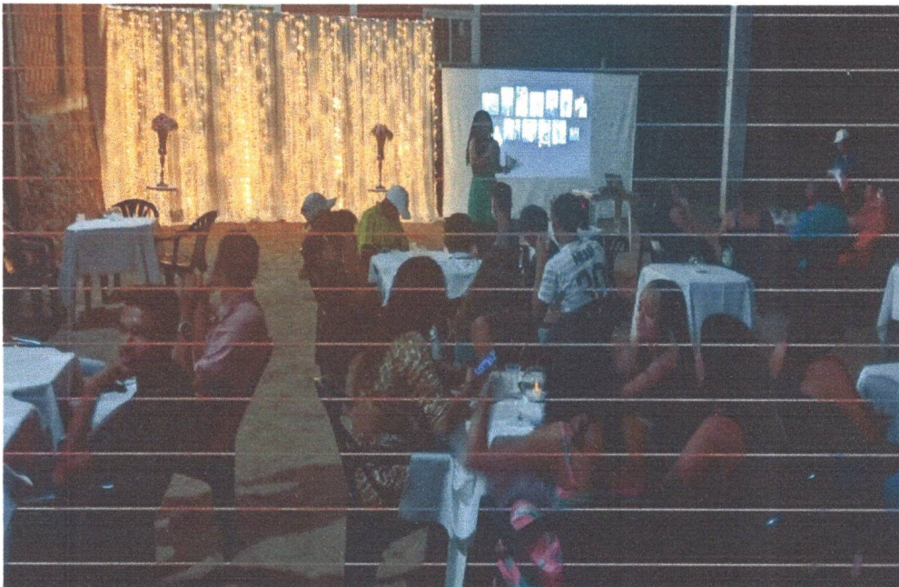
Figura 13: Confraternização