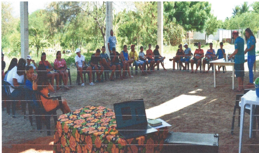
Figura 22: Momento Gincana.