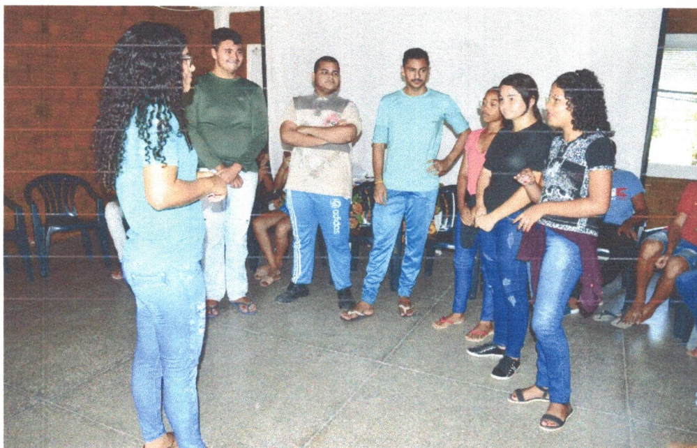
Figura 12: Dinâmica “Quebra Gelo” pegue o bis, responda a pergunta.