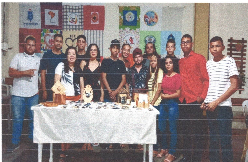
Figura 16: Evento de Encerramento das atividades do Conselho de Direito