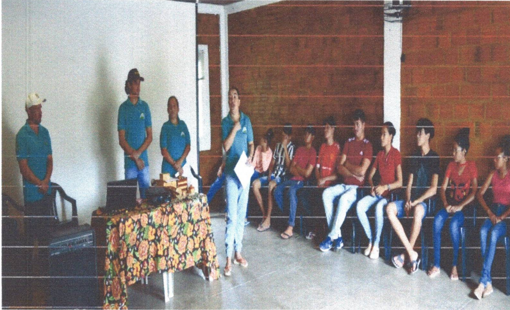
Figura 3: Equipe do Projeto Artes do Sertão participando da Oficina sobre Marchetaria e Biojoias