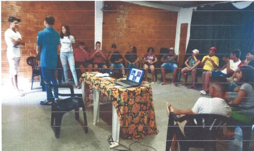
Figura 8: Dinâmica "Verdade e mentira"