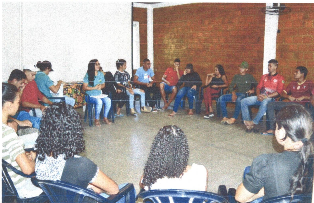
Figura 11: Acompanhamento Pedagógico sobre as atividades do espaço. Dinâmica “Quem eu vou levar”.