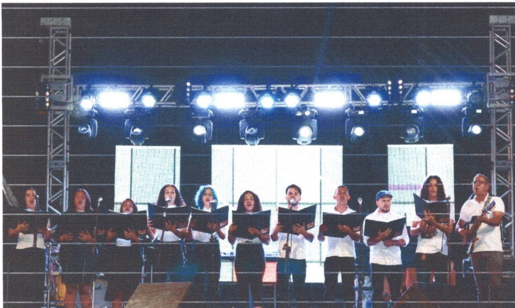
Figura 17: Apresentação do Corai Raízes do Sertão: Evento em Comemoração aos 59 anos de Emancipação Política da Cidade de Ibimirim