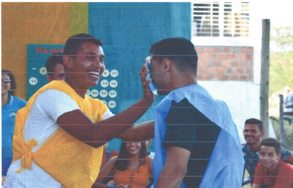
Figura 24: Momento de descontração!