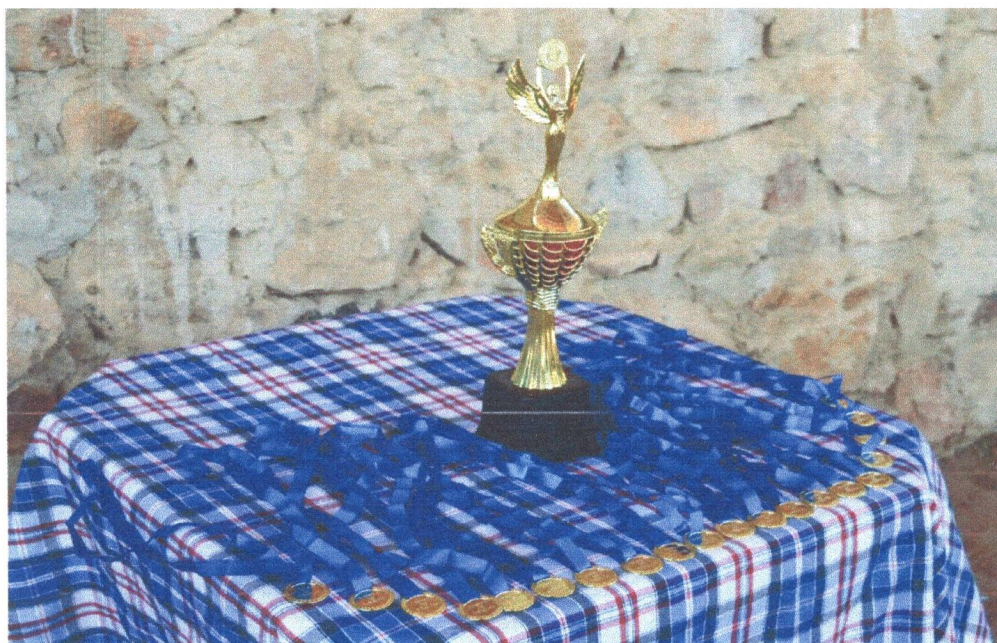
Figura 20: Premiação para a Gincana