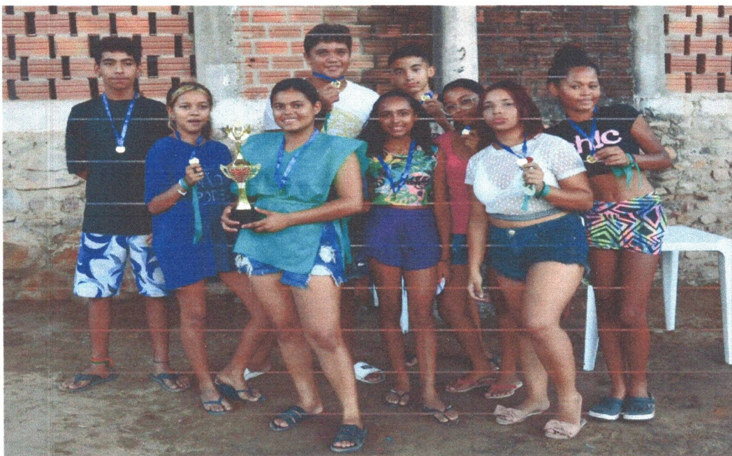
Figura 25: Equipe Verde Campeã da Gincana.