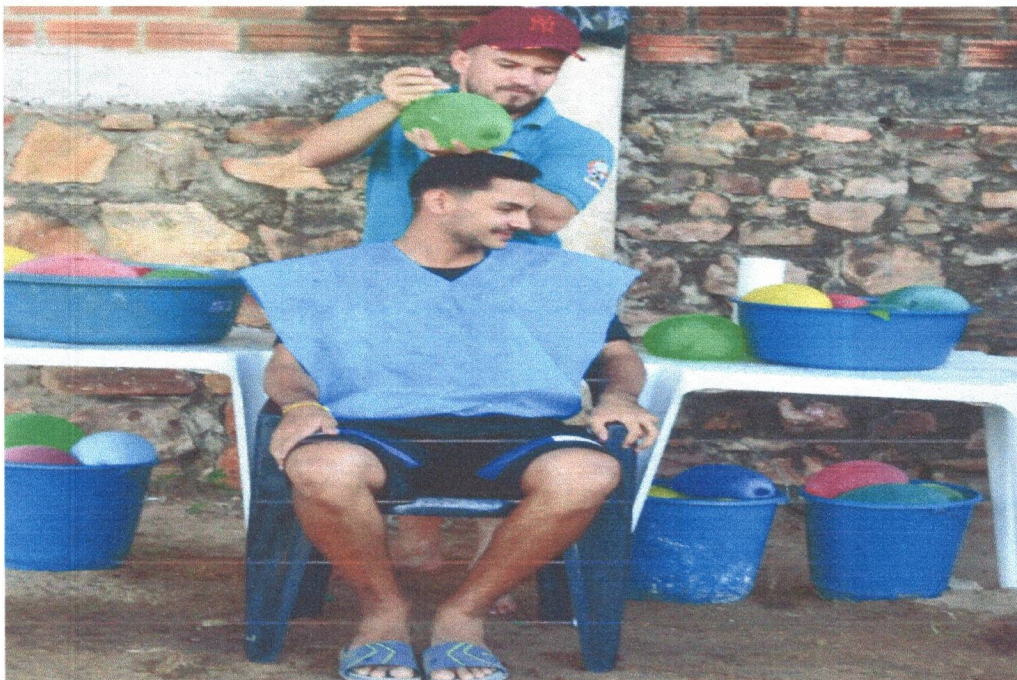
Figura 24: Dinâmica “Balão d’água”: Testando seus conhecimentos.