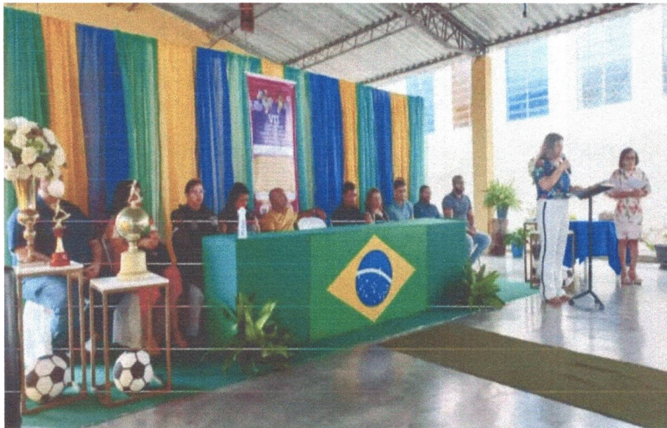
Figura 1: VII Conferência Municipal dos Direitos da Criança e do Adolescente