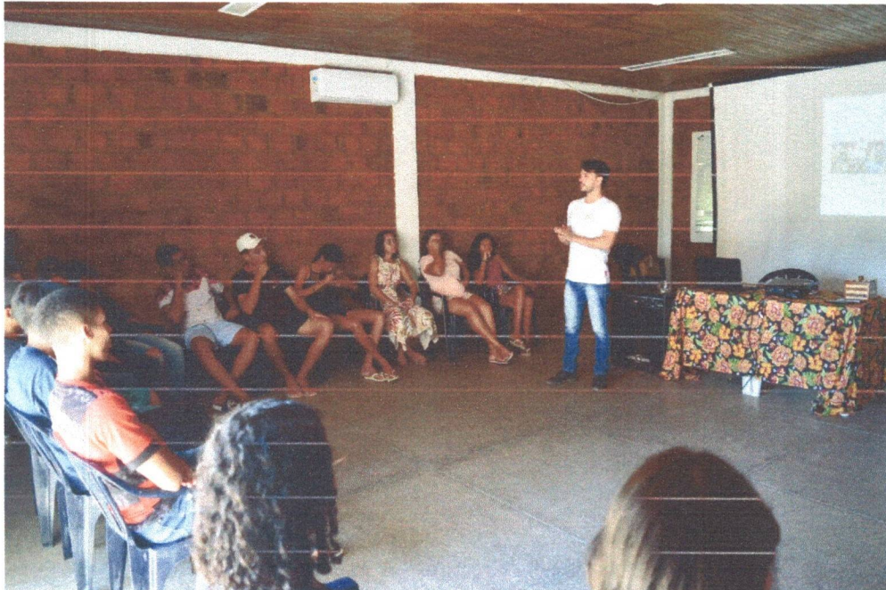
Figura 9: Roda de conversa dentro da oficina dos Resíduos orgânicos