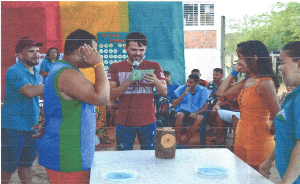
Figura 23: Torta na cara: Perguntas e Respostas