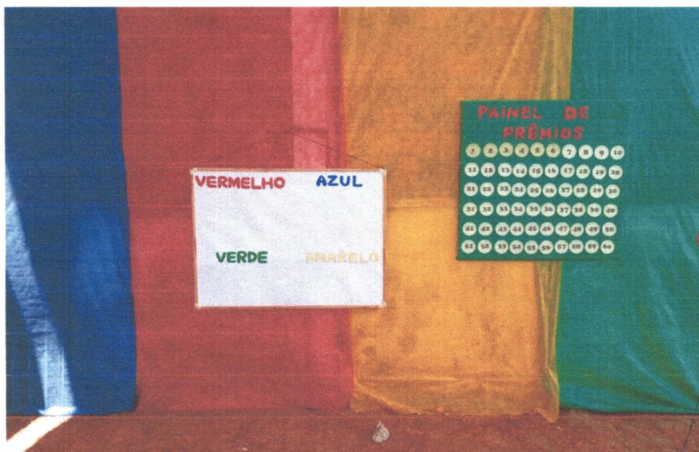
Figura 18: Organização da I Gincana Educacional