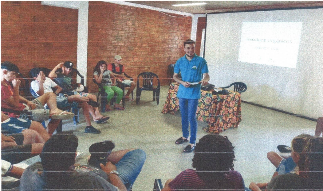
Figura 7: Oficina de Conhecimentos gerais sobre o Setor dos Resíduos Orgânicos