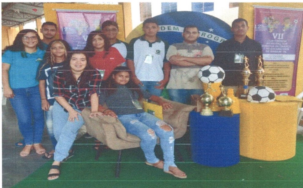
Figura 2: VII Conferência Municipal dos Direitos da Criança e do Adolescente