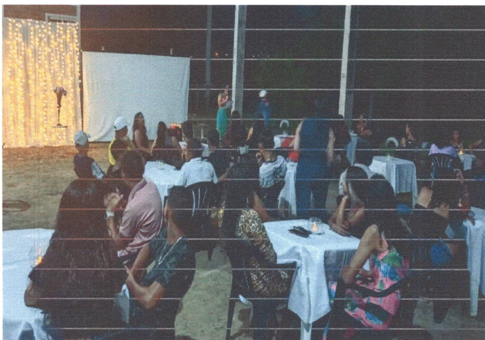
Figura 14: Confraternização e homenagem para os adolescentes.