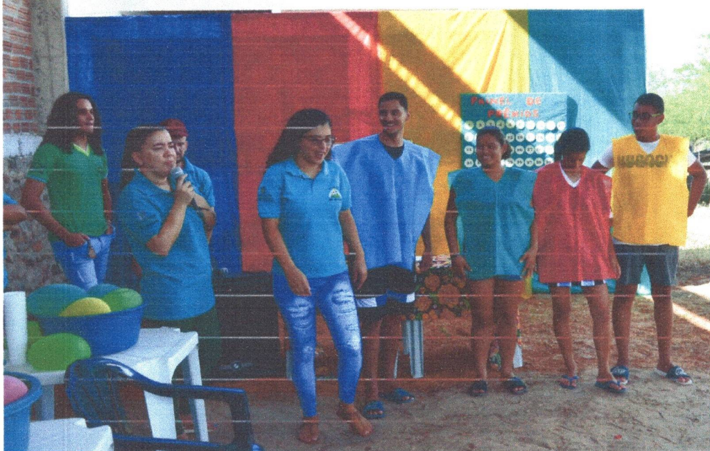
Figura 21: Organização das equipes