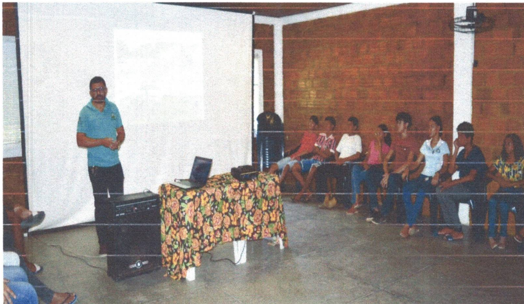
Figura 5: Oficina de Conhecimentos gerais sobre o Setor da Sementeira