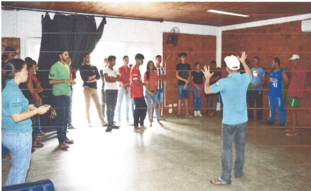
Figura 4: Oficina de Conhecimento sobre Artesanatos em Marchetaria e Biojoias dinâmica “Caça ao Tesouro”