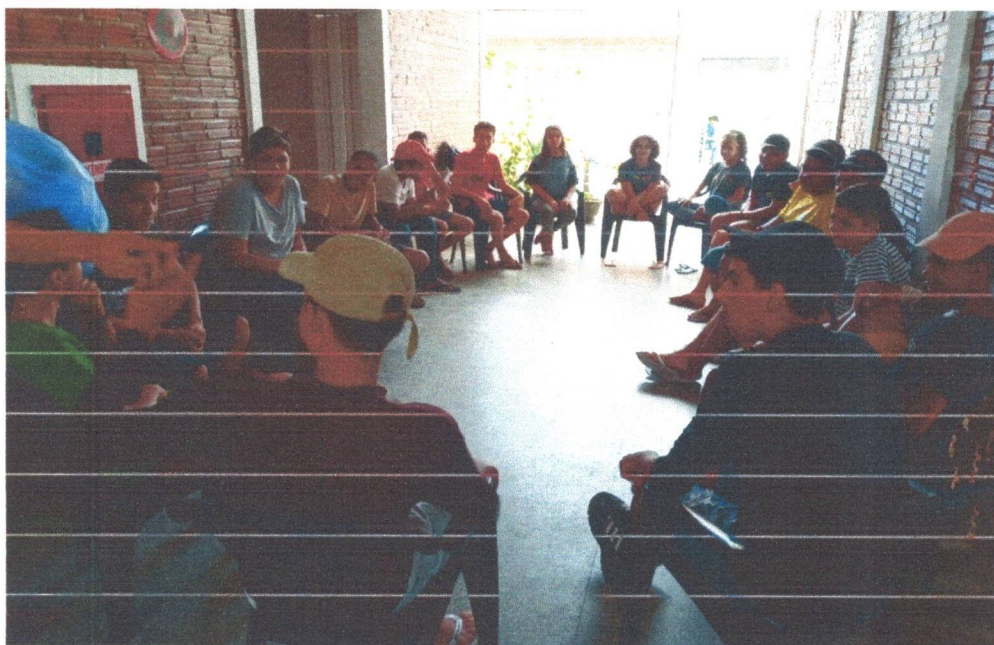
Figura 10: Momento de diálogos e brincadeiras