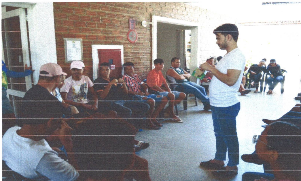
Figura 6: Oficina de Conhecimento sobre Meio Ambiente