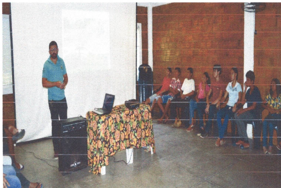
Figura 4: Oficina de Conhecimentos gerais sobre o Setor da Sementeira