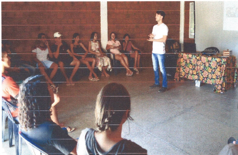
Figura 5: Oficina de Conhecimento sobre Meio Ambiente