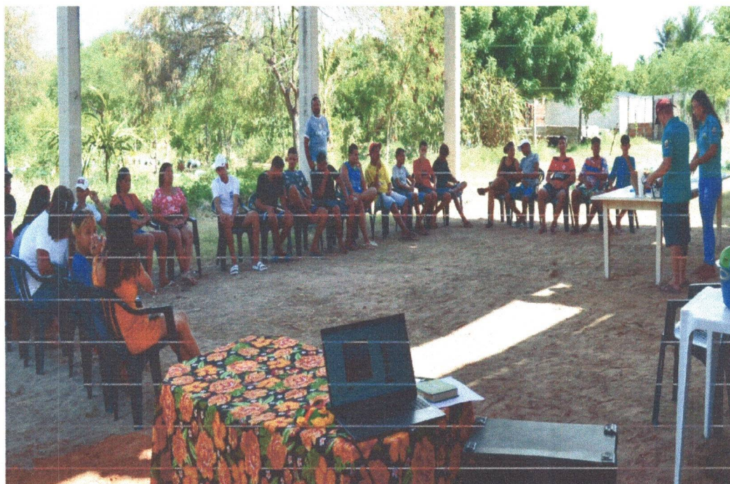
Figura 17: Momento Gincana.