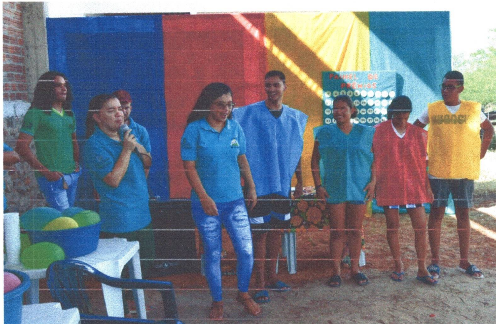
Figura 16: Organização das equipes