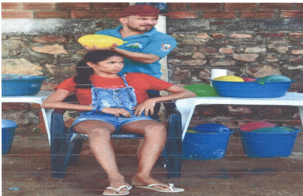
Figura 19: Dinâmica "Balão d'água": Testando seus conhecimentos.