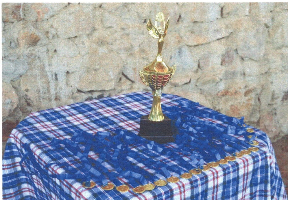
Figura 15: Premiação para a Gincana