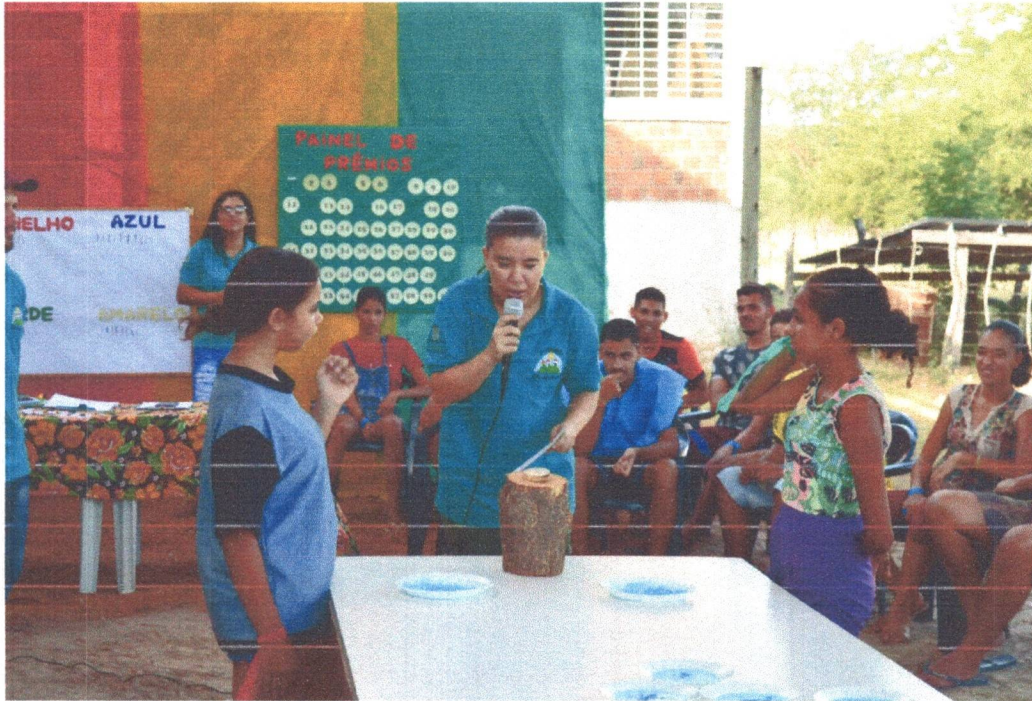
Figura 18: Torta na cara: Perguntas e Respostas