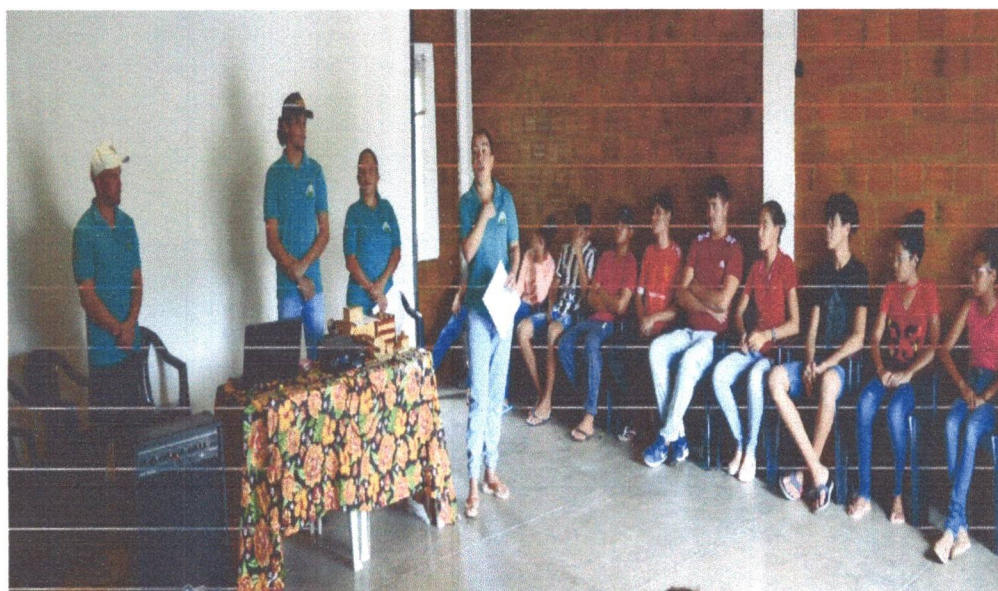
Figura 2: Equipe participando da Oficina sobre Marchetaria e Biojoias