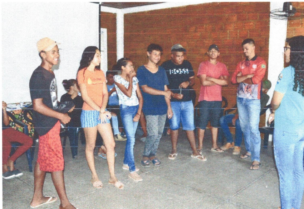
Figura 9: Dinâmica “Quebra Gelo” pegue o bis, responda a pergunta.