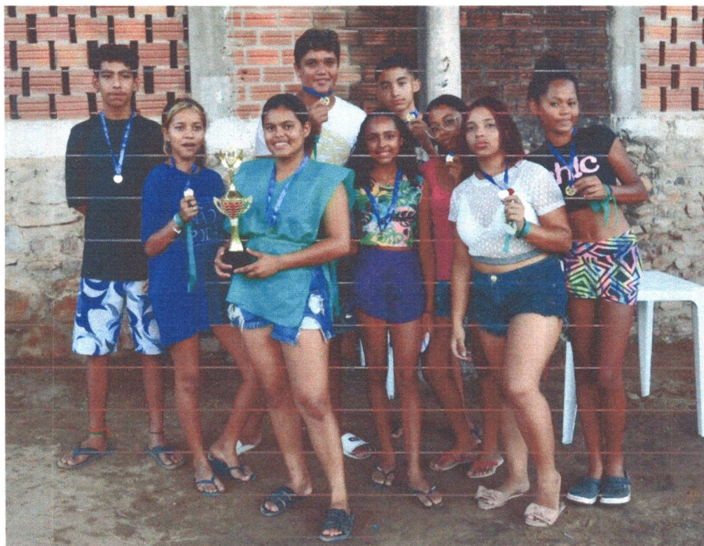
Figura 20: Equipe Verde Campeã da I Gincana. Educacional da Associação Umburanas.