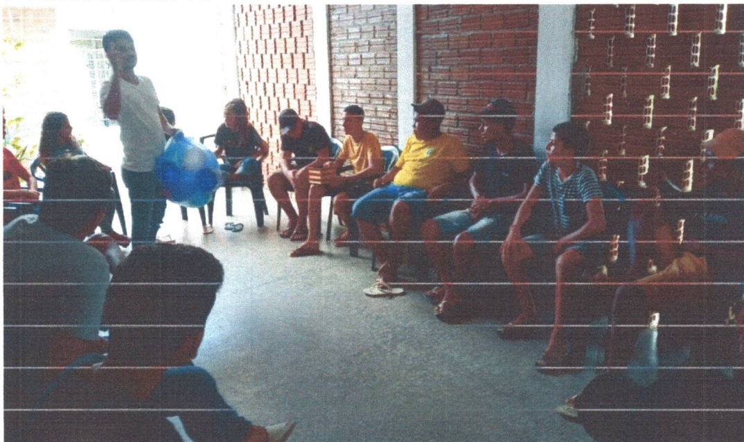
Figura 7: Momento de diálogos e brincadeiras