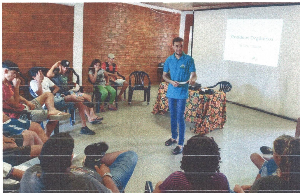
Figura 6: Oficina de Conhecimentos gerais sobre o Setor dos Resíduos Orgânicos