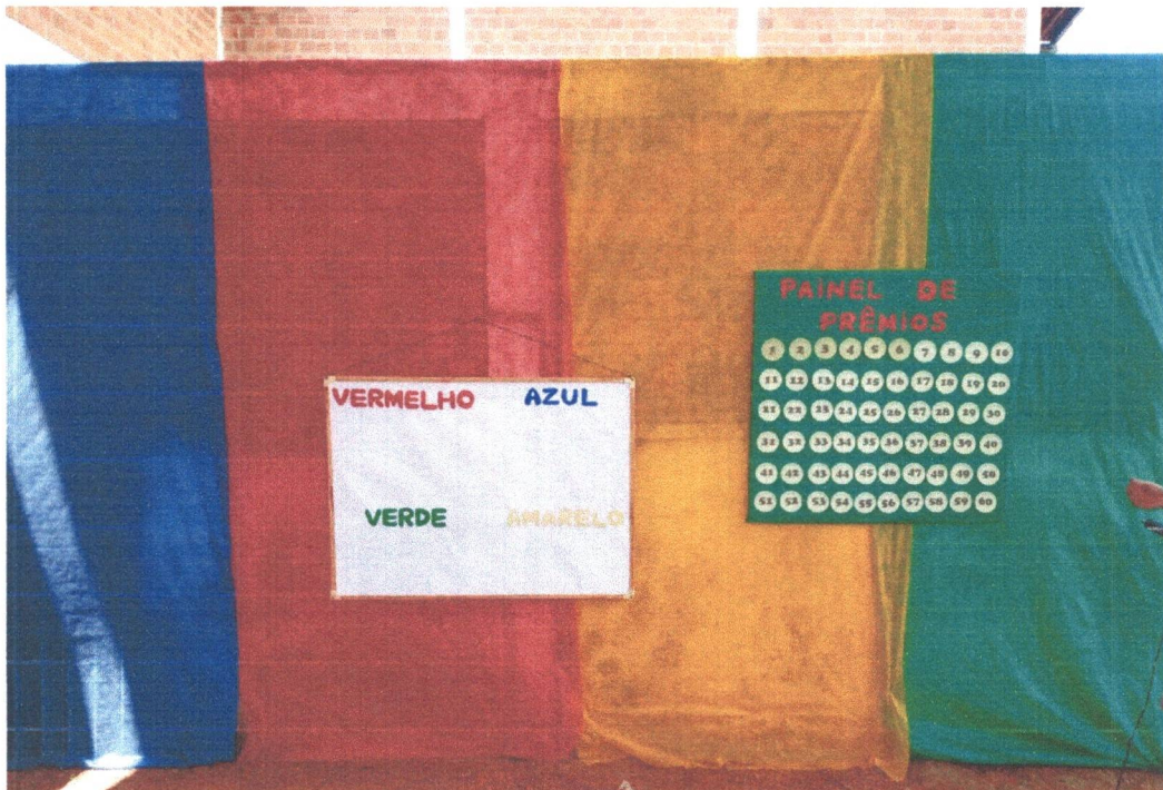
Figura 13: Organização da I Gincana Educacional