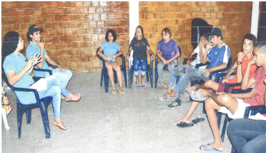
Figura 8: Acompanhamento Pedagógico sobre as atividades do espaço, Dinâmica “Quem eu vou levar”.