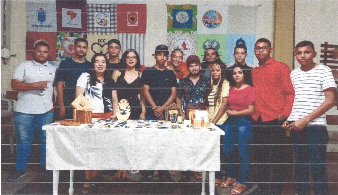
Figura 12: Evento de Encerramento das atividades do Conselho de Direito