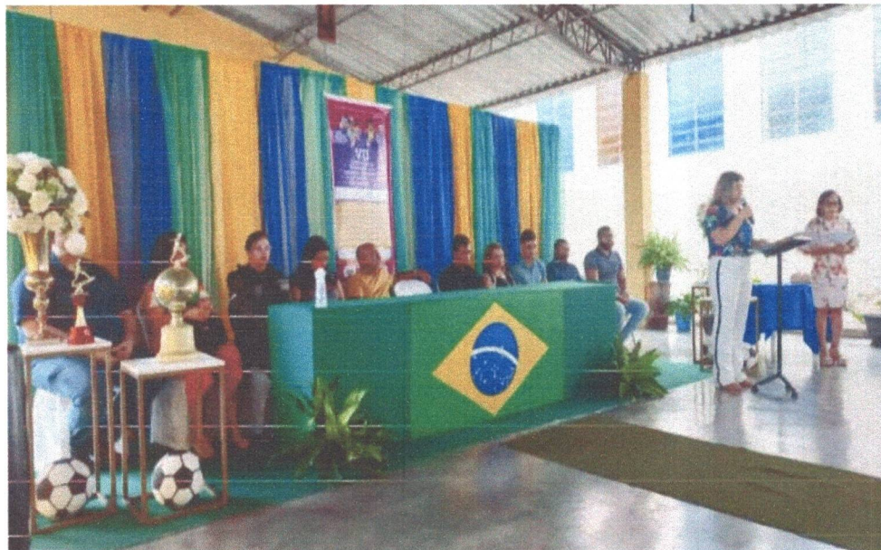
Figura 1: VII Conferência Municipal dos Direitos da Criança e do Adolescente