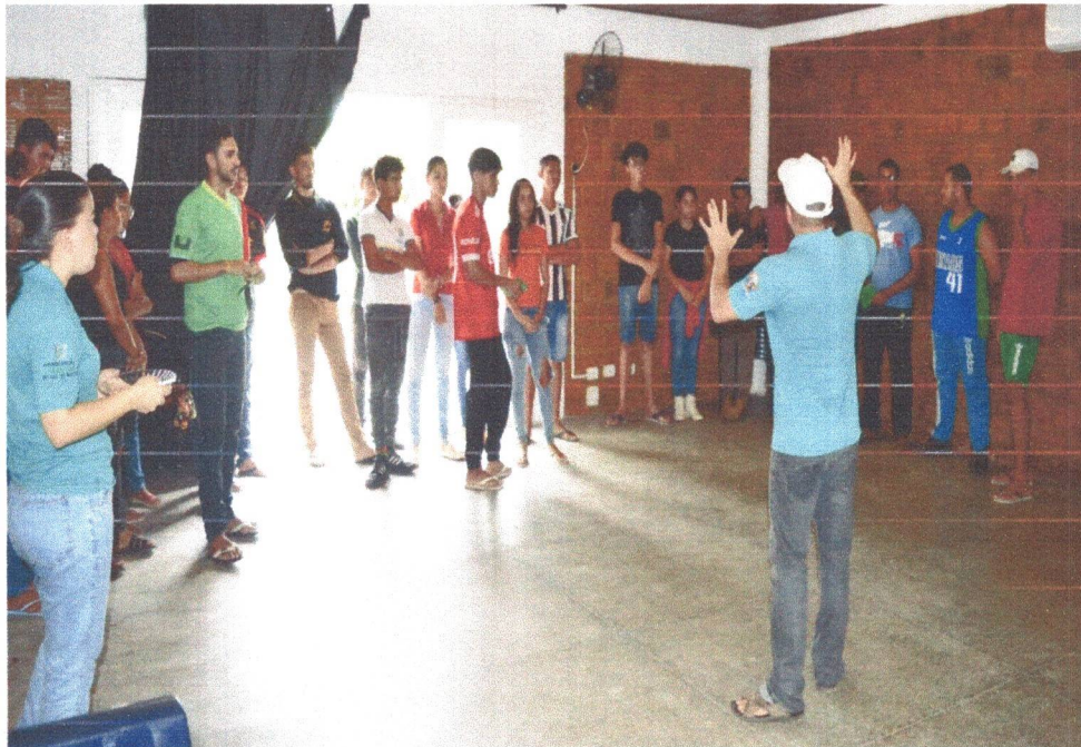
Figura 3: Oficina de Conhecimento sobre Artesanatos em Marchetaria e Biojoias dinâmica “Caça ao Tesouro”