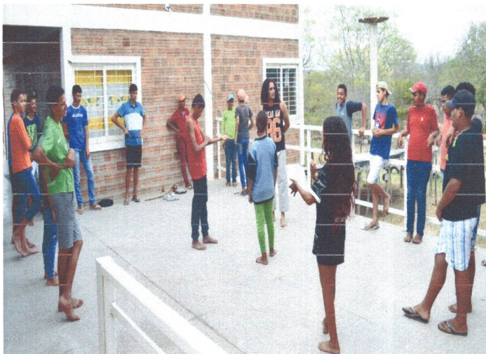
Figura 10: Oficina de Capoeira para os adolescentes