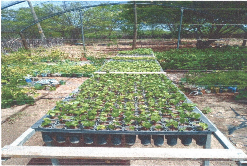
Figura 15: Plantio de mudas nos tubetes