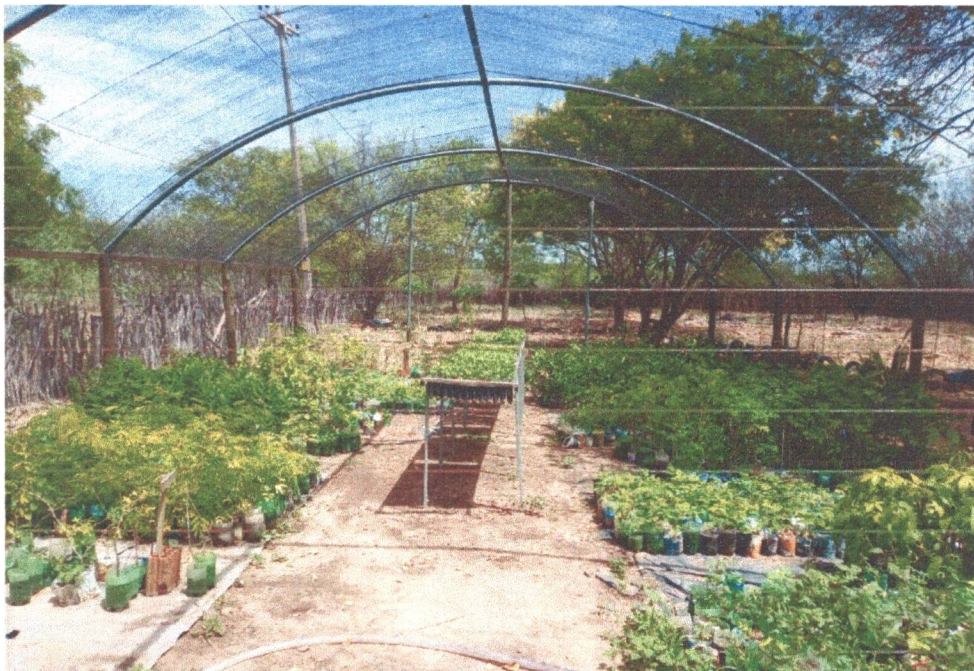
Figura 16: Organização da estufa