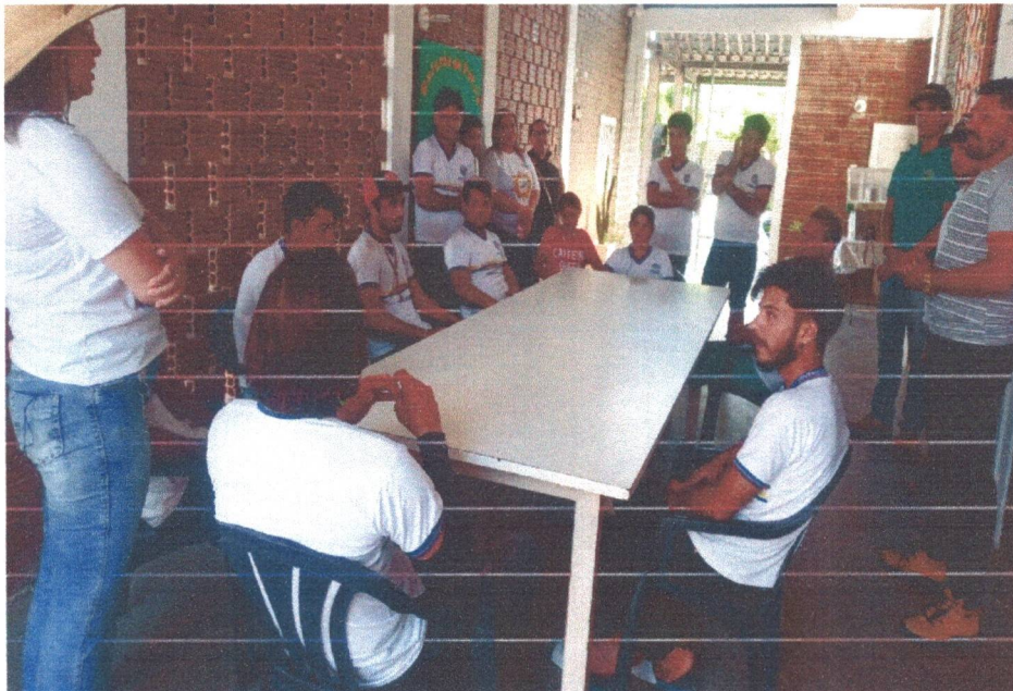
Figura 5: Visita dos alunos da Escola Iracema Moura de Morais Veras, com a turma da EJA Campo