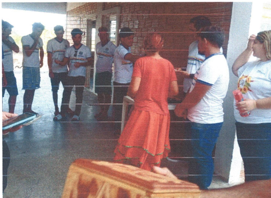
Figura 6: Visita dos alunos da Escola Iracema Moura de Morais Veras, com a turma da EJA Campo