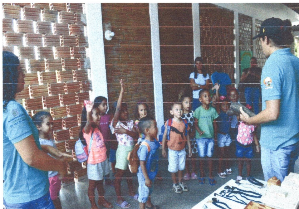
Figura 2: Visita da Escola Simão Izidio de Souza