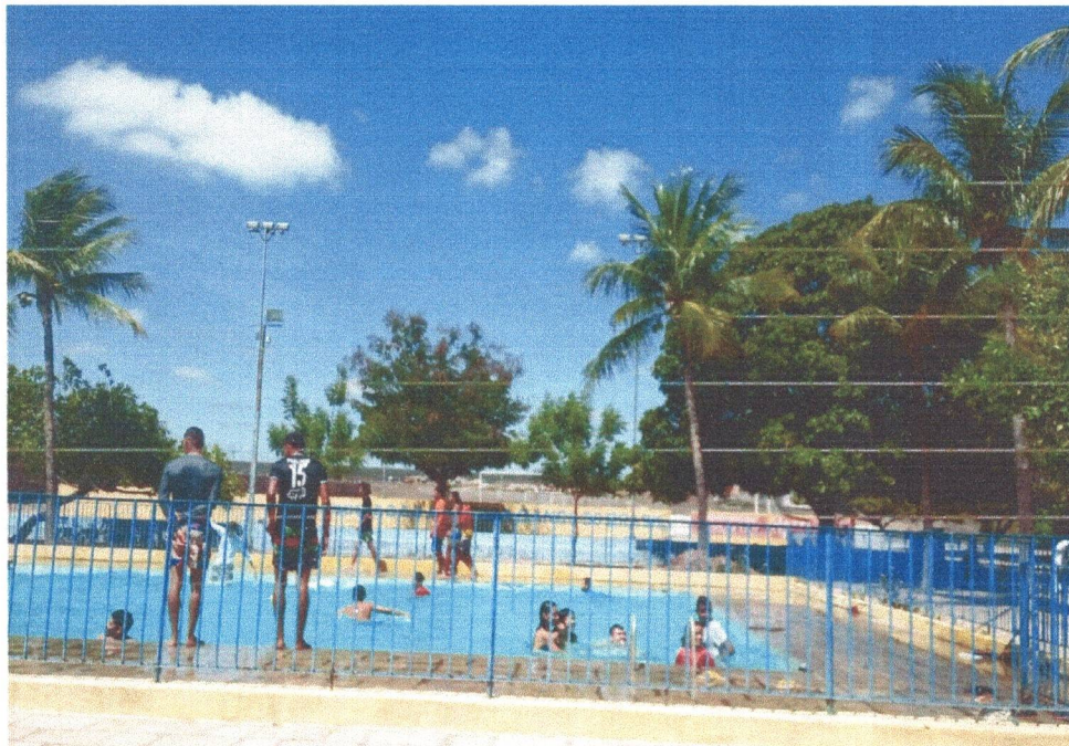
Figura 11: Dia de Lazer para os adolescentes na AAB