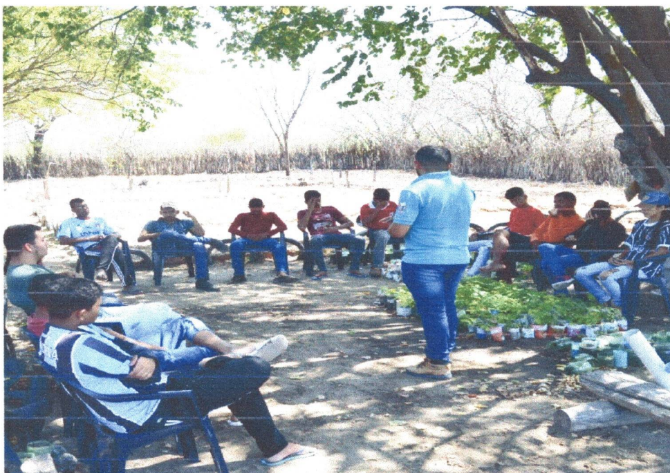
Figura 8: Roda de Conversa com os adolescentes do Projeto Minha Cidade, Minha Imagem.