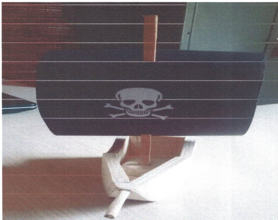
Figura 14: Encomenda para trabalho escolar: Barquinho Pirata