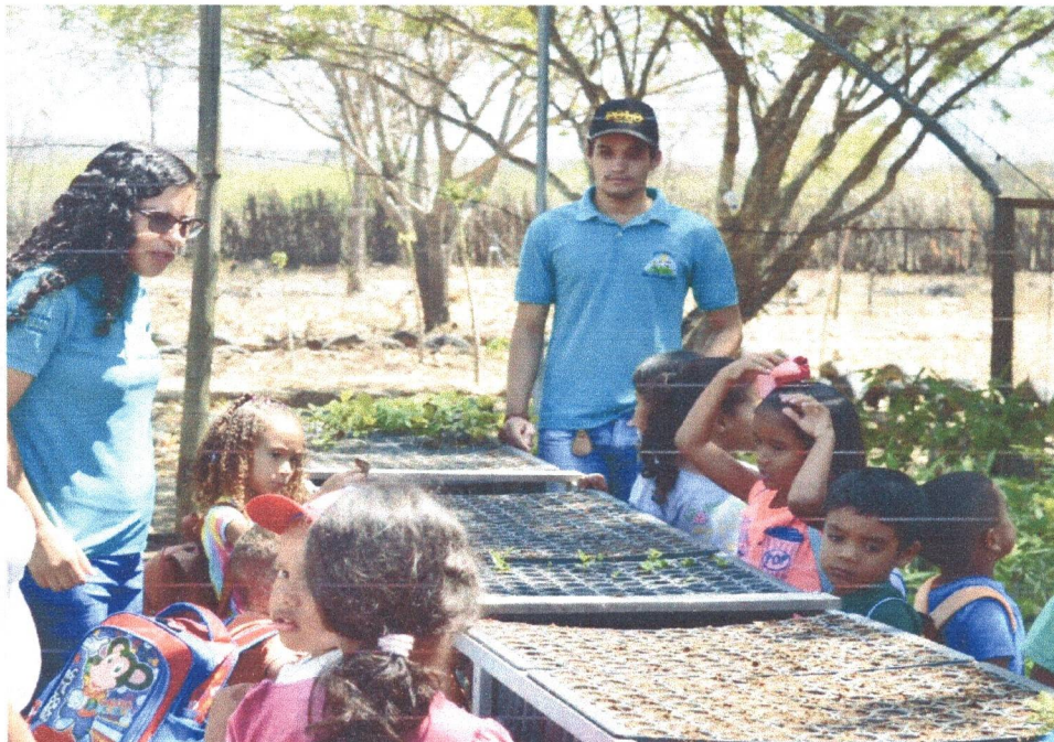
Figura 4: Alunos da Escola Simão Izídio conhecendo as atividades no setor da Sementeira