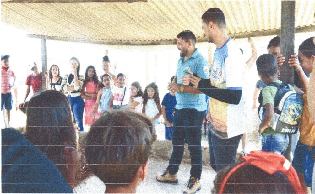
Figura 3: Alunos da Escola Simão Izídio conhecendo as atividades no setor dos Resíduos Orgânicos