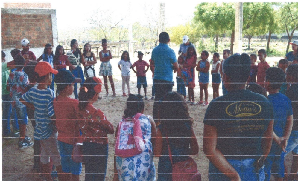
Figura 1: Visita da Escola Simão Izidio de Souza