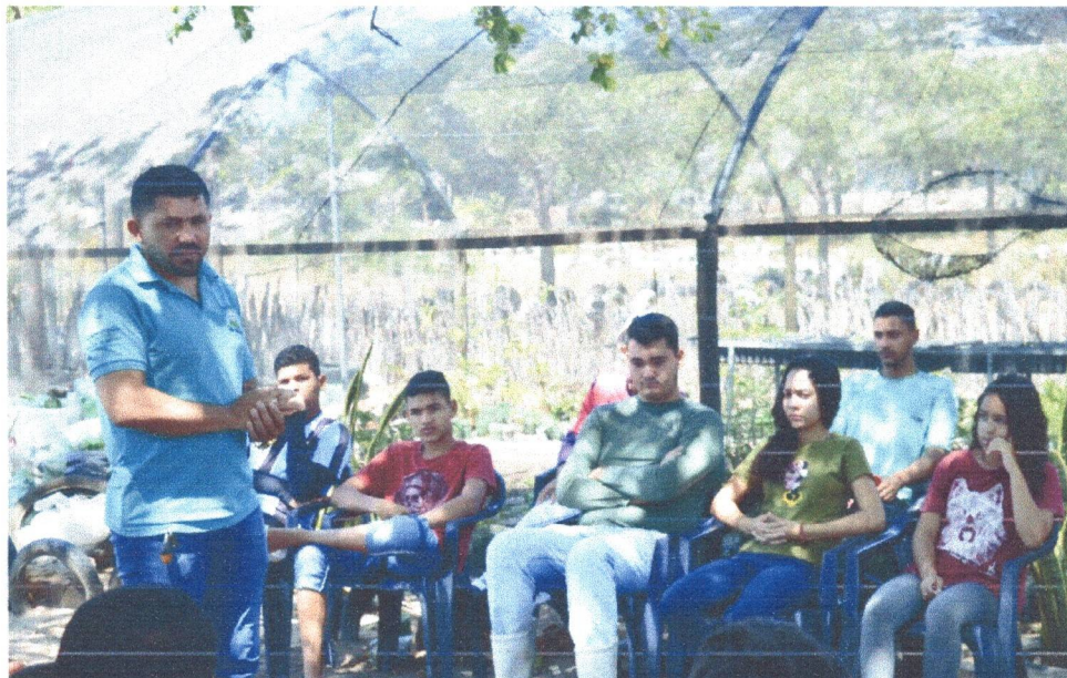
Figura 7: Roda de Conversa com os adolescentes do Projeto Minha Cidade, Minha Imagem.