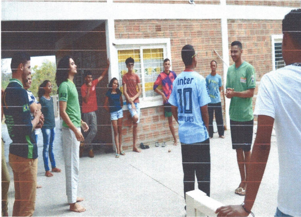
Figura 9: Oficina de Capoeira para os adolescentes