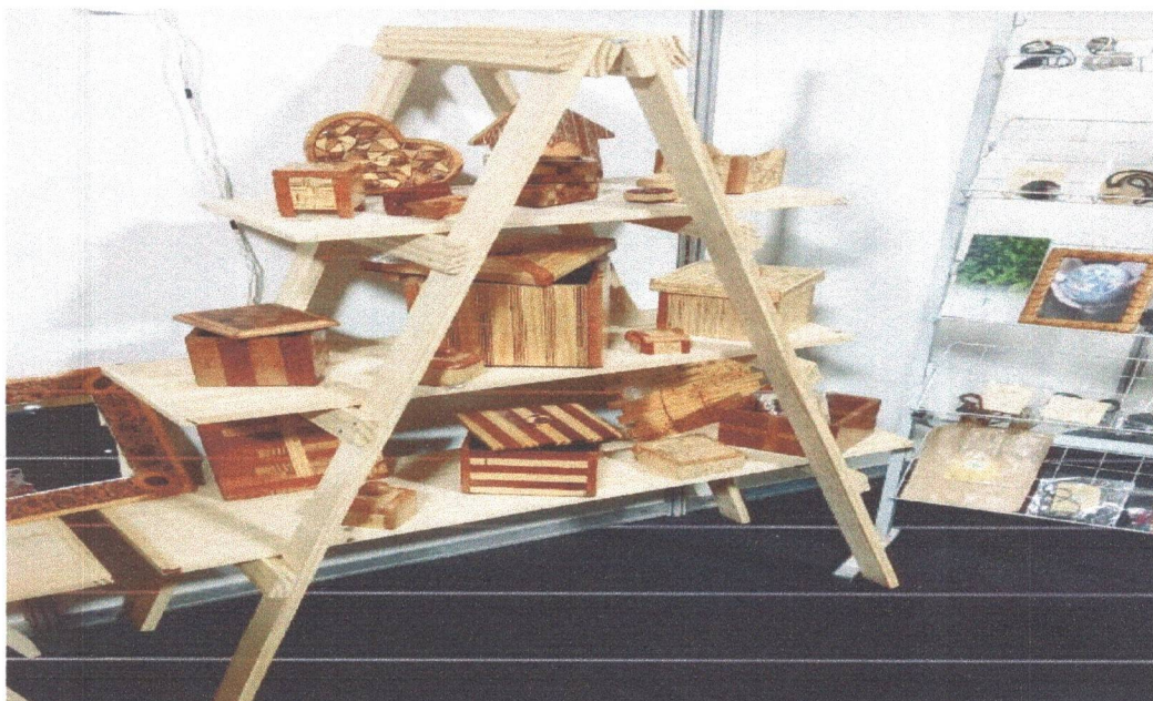
Figura 8: Exposição das peças em marchetaria