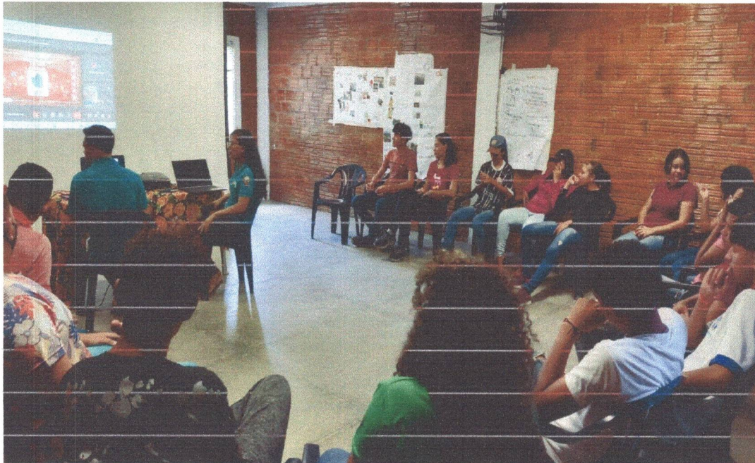
Figura 3: Palestra para os adolescentes com os voluntários do Banco Santander