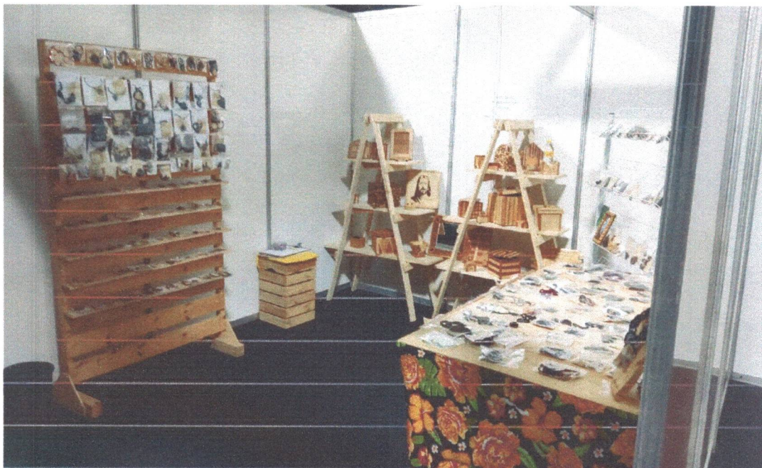
Figura 6: Participação na Feira Giro Criativo em Arcoverde