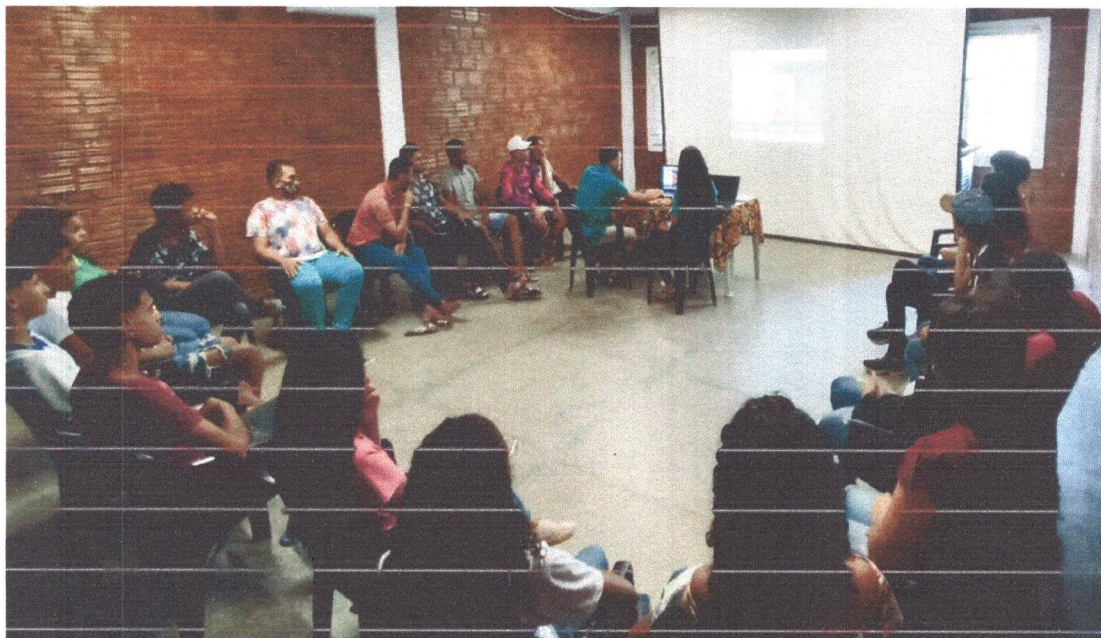
Figura 4: Palestra para os adolescentes com os voluntários do Banco Santander