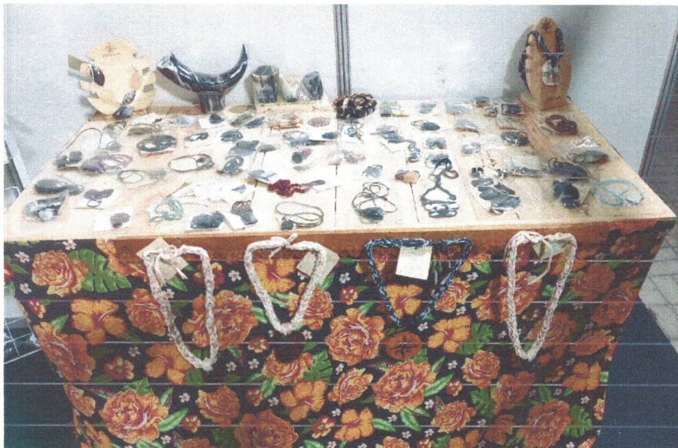
Figura 7: Exposição das biojoias