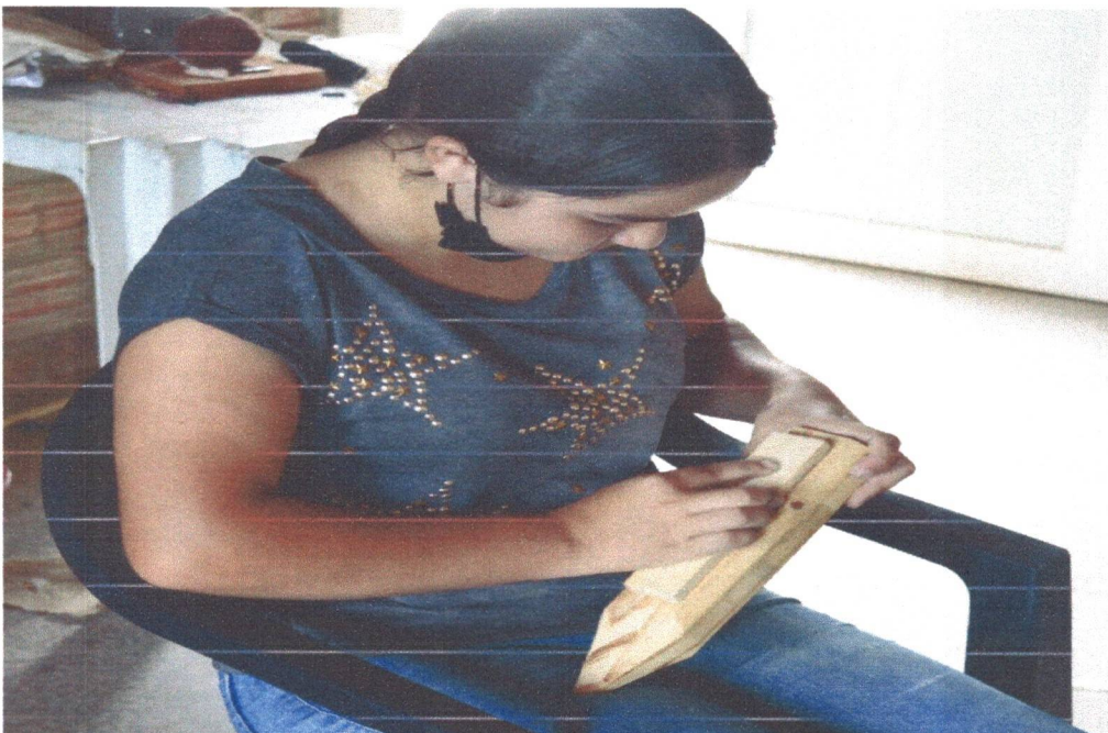
Figura 10: Adolescente na atividade de produção