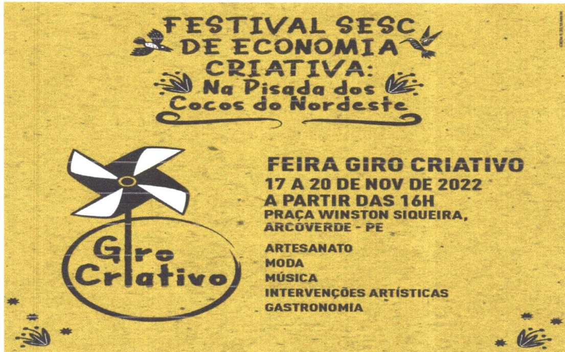
Figura 5: Feira Giro Criativo