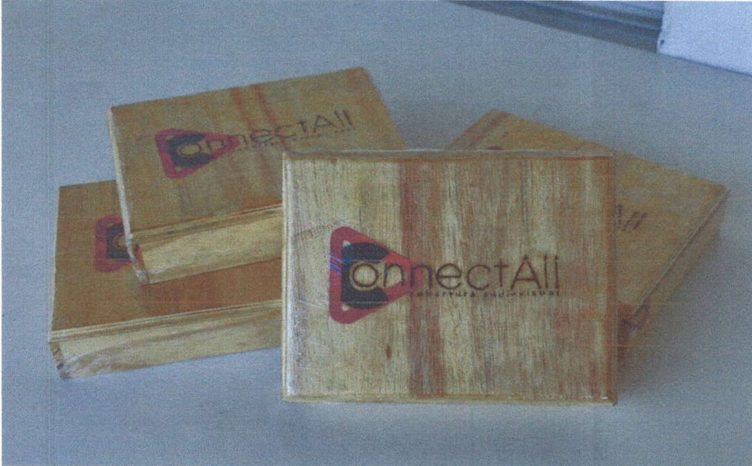
Figura 11: Caixas produzidas com refugo de madeira, pirografadas.