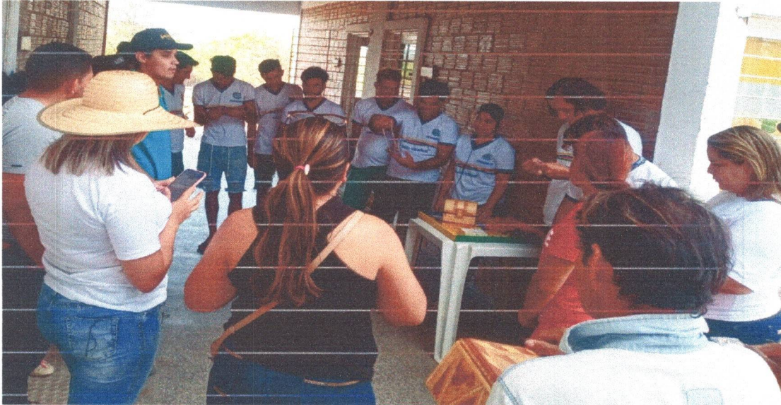
Figura 6: Visita dos alunos da Escola Iracema Moura de Morais Veras. com a turma da EJA Campo