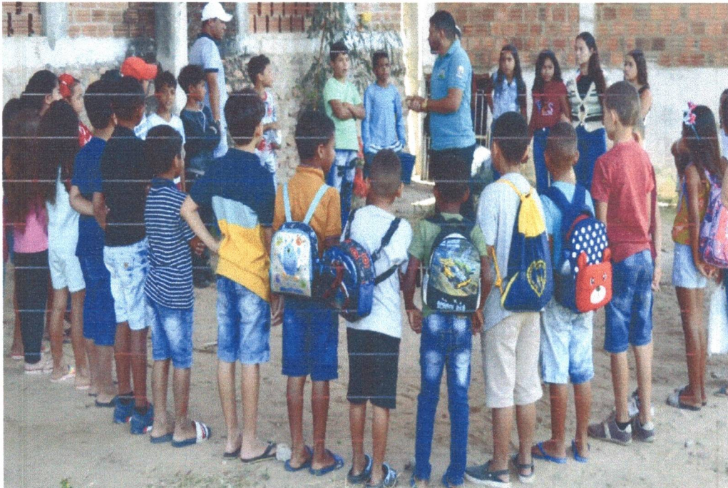
Figura 1: Visita dos alunos da Escola Simão Izídio