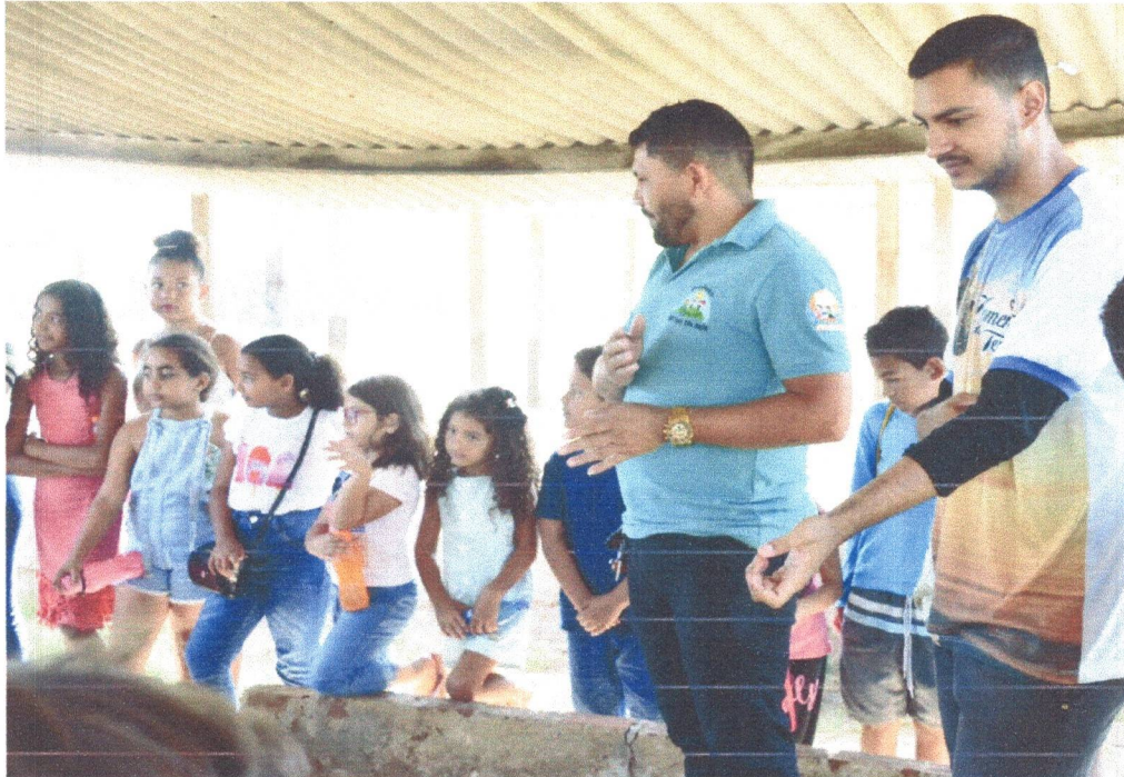
Figura 3: Alunos da Escola Simão Izídio conhecendo as Atividades no Setor dos Resíduos Orgânicos