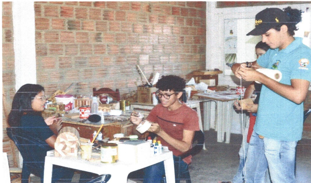
Figura 11: Momento de atividade no Ateliê de marchetaria.