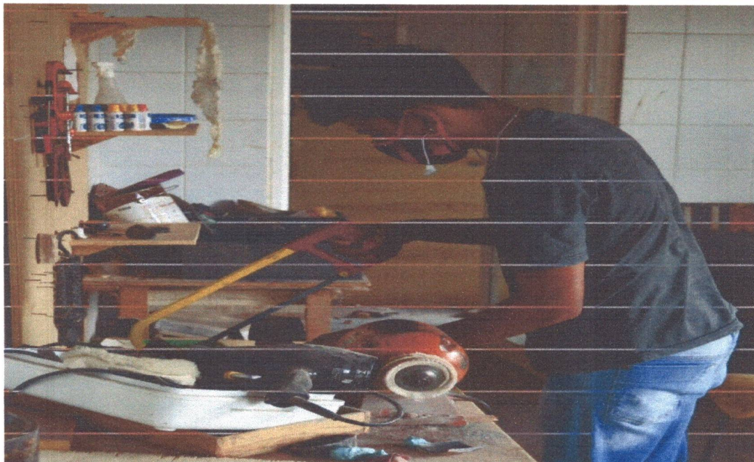
Figura 10: Momento de utilização das ferramentas pelos adolescentes.