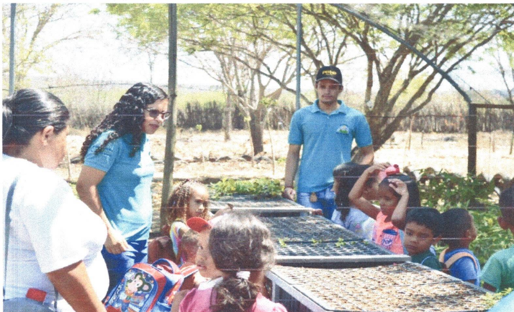
Figura 4: Alunos da Escola Simão Izídio conhecendo as Atividades no Setor da Sementeira.