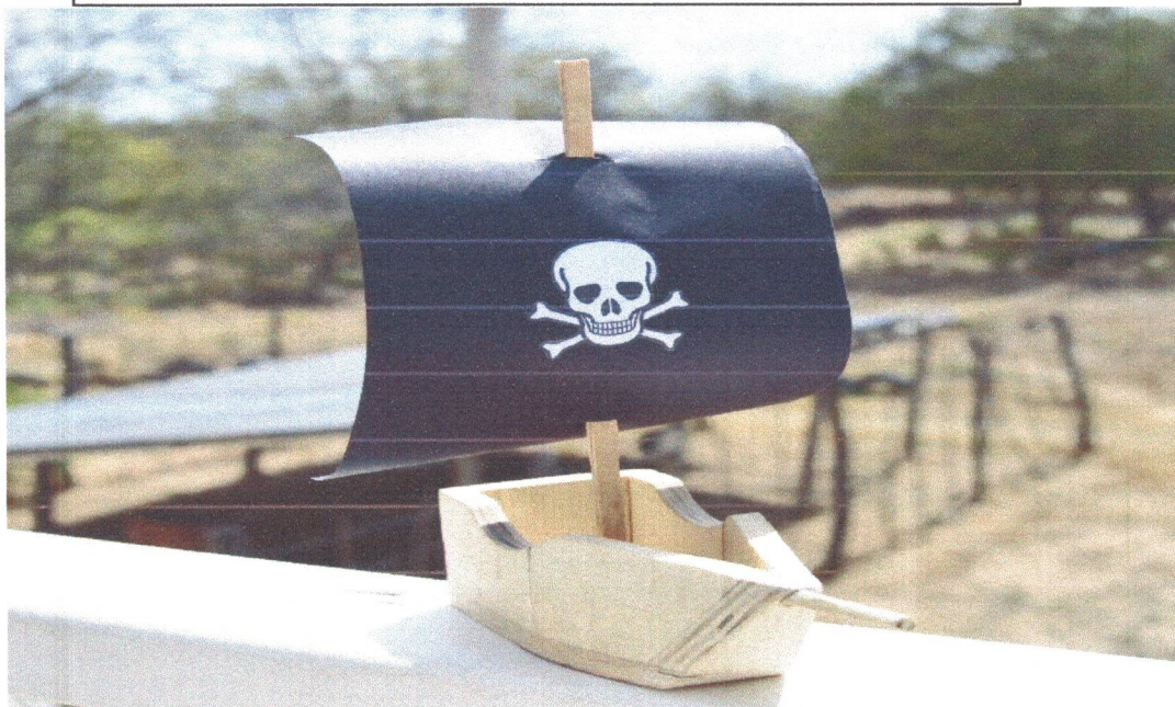
Figura 13: Encomenda para Trabalho Escolar – Barquinho Pirata