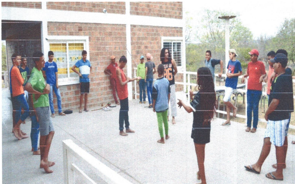
Figura 7: Oficina de Capoeira para os adolescentes