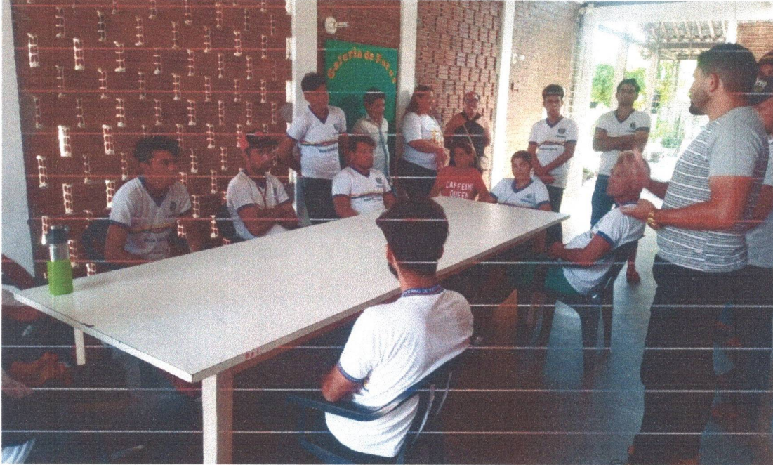
Figura 5: Visita dos alunos da Escola Iracema Moura de Morais Veras. com a turma da EJA Campo