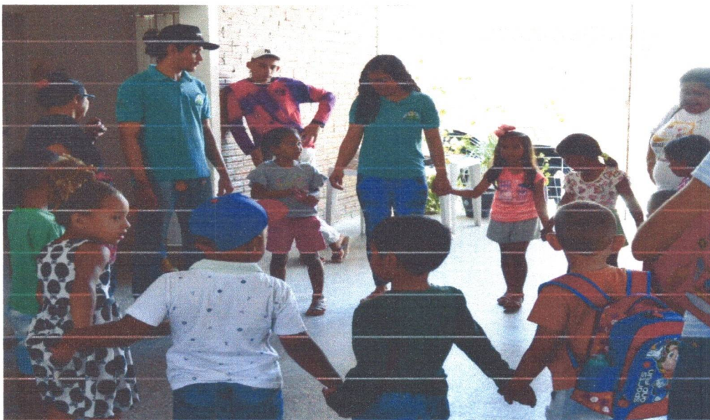
Figura 2: Visita dos alunos da Escola Simão Izídio