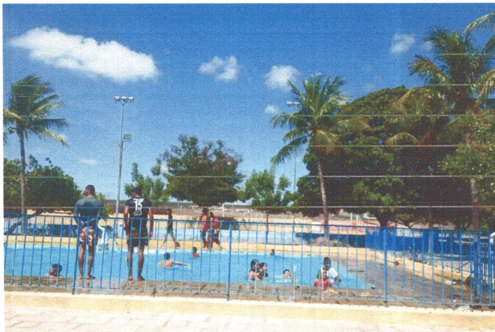
Figura 8: Dia de Lazer pra os adolescentes na AABB